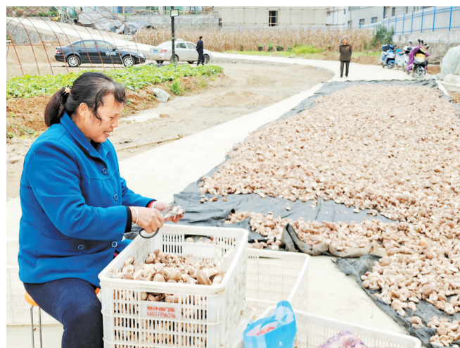
近日,丹凤县武关镇群众正在晾晒香菇。武关镇重视特色产业发展,用产业发展的“毛坪模式”引导全镇群众自主发展香菇、天麻产业,将有能力的贫困户镶嵌在产业链上,全镇发展香菇600万袋,为群众持续增收奠定了坚实基础。