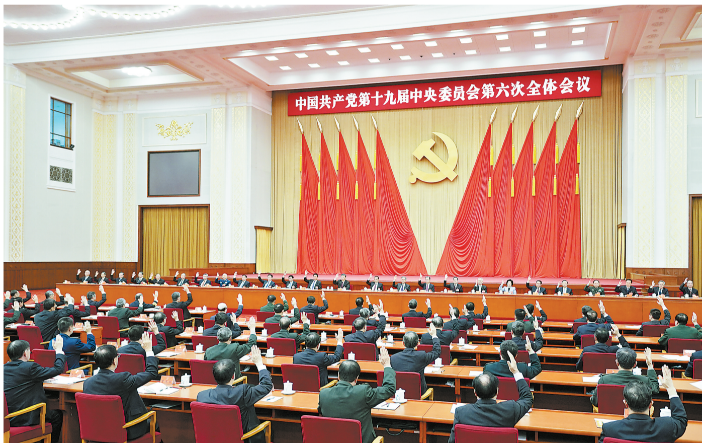
中国共产党第十九届中央委员会第六次全体会议，于2021年11月8日至11日在北京举行。中央政治局主持会议。