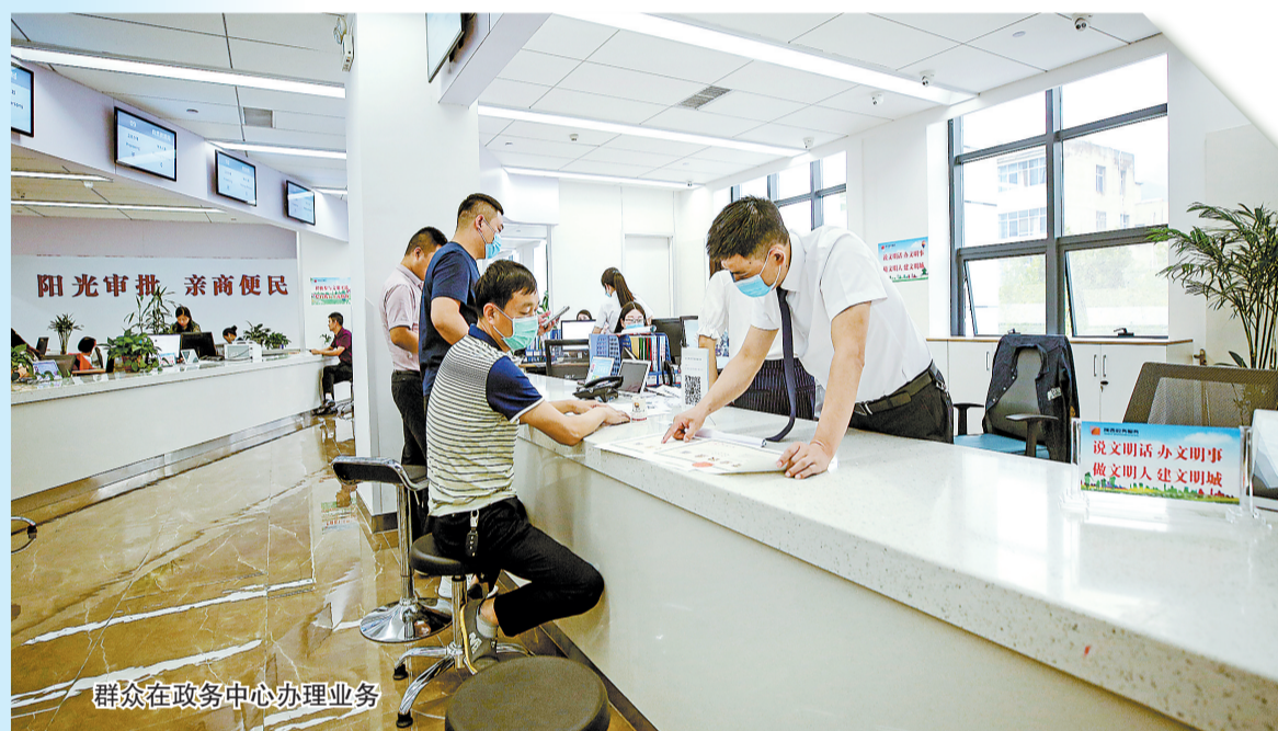
群众在政务中心办理业务