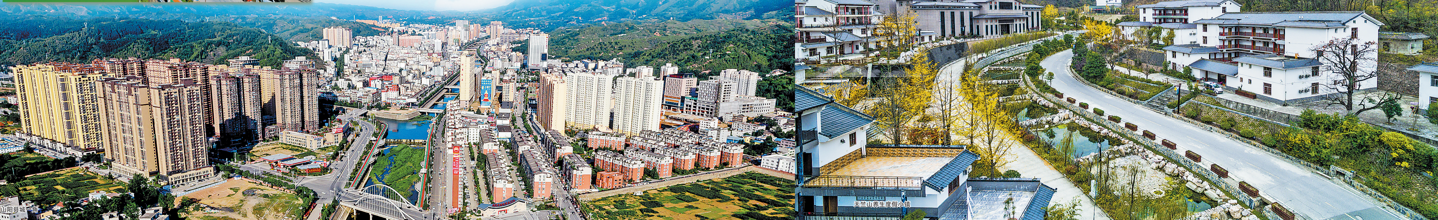
天竺山秦生度假小镇