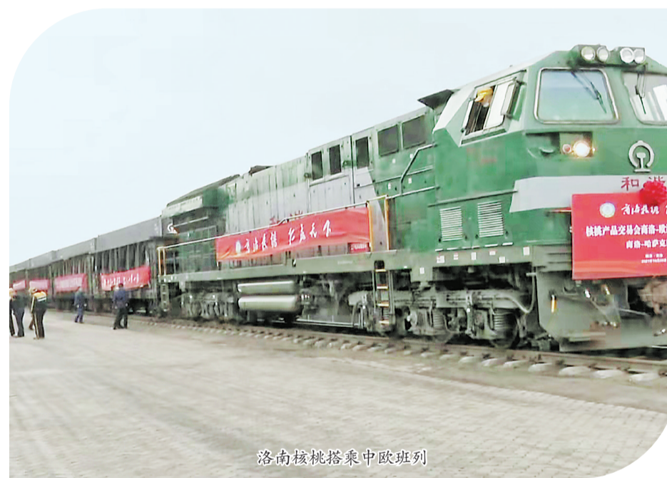
洛南核铁路中欧班列