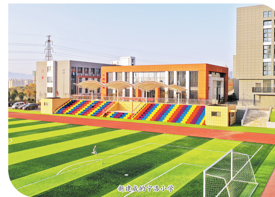
新建成的宁城小学