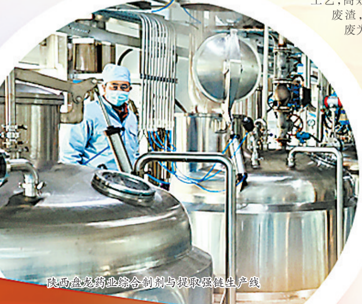
陕西盘龙药业综合制剂与提取强链生产线