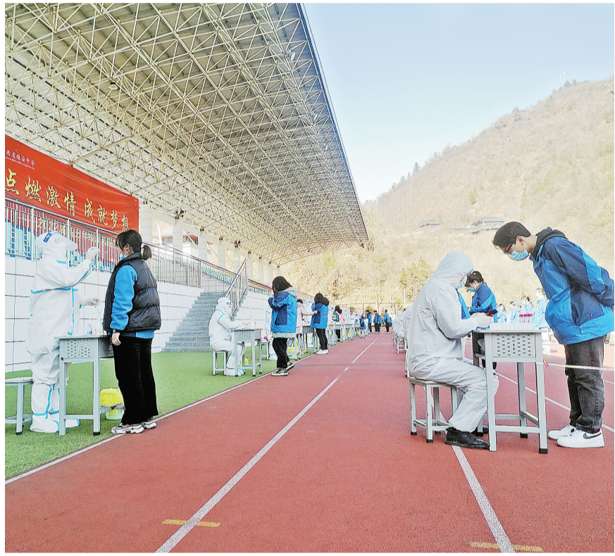
12月29日,镇安中学筑牢校园疫情防控墙,医护人员为全校5000多名师生进行核酸检测。

习宣传疫情防控知识,利用网站、微博、微信和农村大喇叭等平台,做好疫情防控权威发布、政策法规宣传、科学知识普及等工作,自觉做到并劝导亲朋好友严格遵守疫情防控要求,不恐慌、不信谣、不传谣,不聚集、少流动、非必要不出门。带头倡导落实文明健康生活方式,喜事缓办、丧事简办、宴会不办。