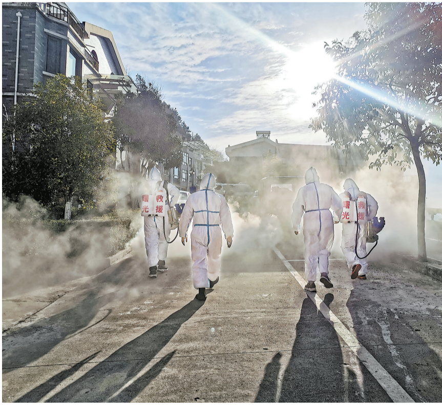
连日来,柞水县乾佑街办迎春社区对辖区内人口密集的小区公共场所进行疫情防疫消毒消杀,筑牢小区防疫屏障。图为小区防疫消毒现场。