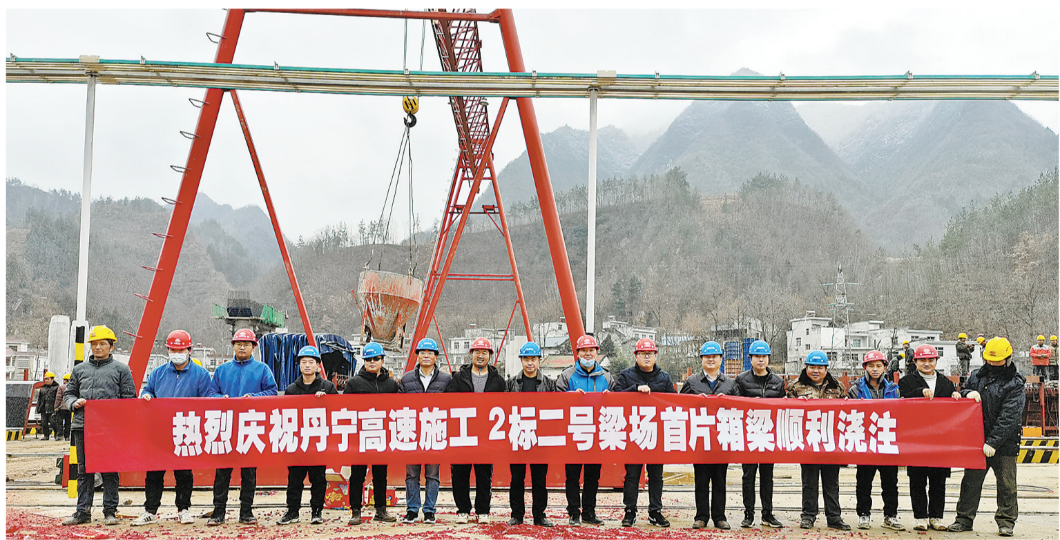
热烈庆祝丹宁高速施工2标二号梁场首片箱梁顺利浇筑