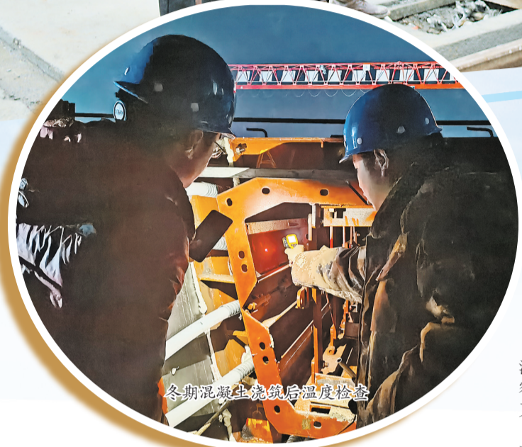
冬期混凝土浇筑后温度检查