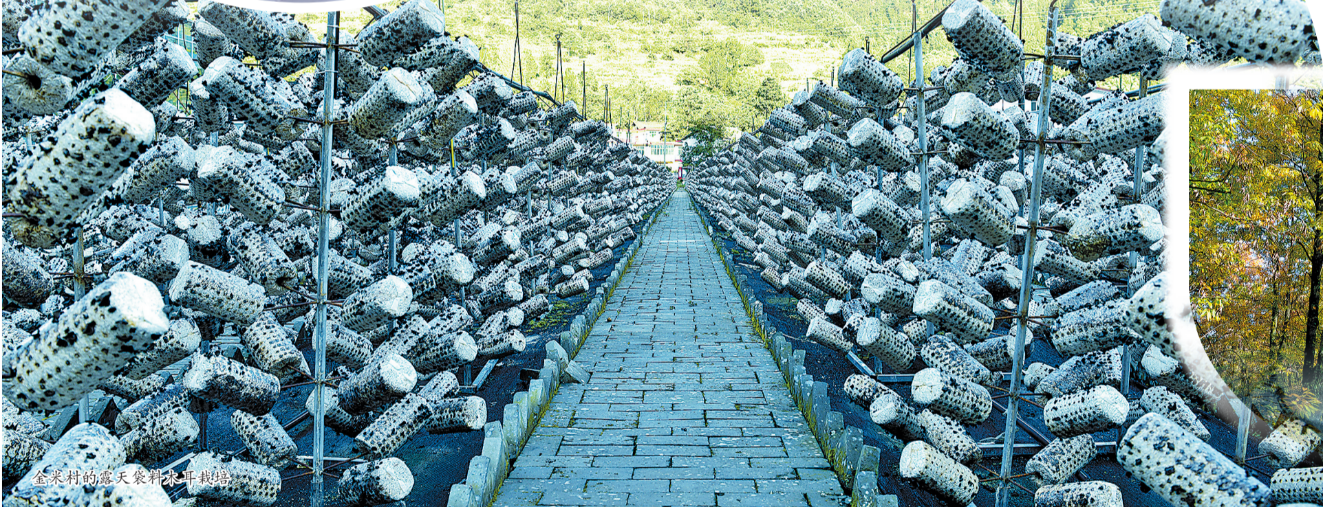
金米村的露天袋料木耳栽培