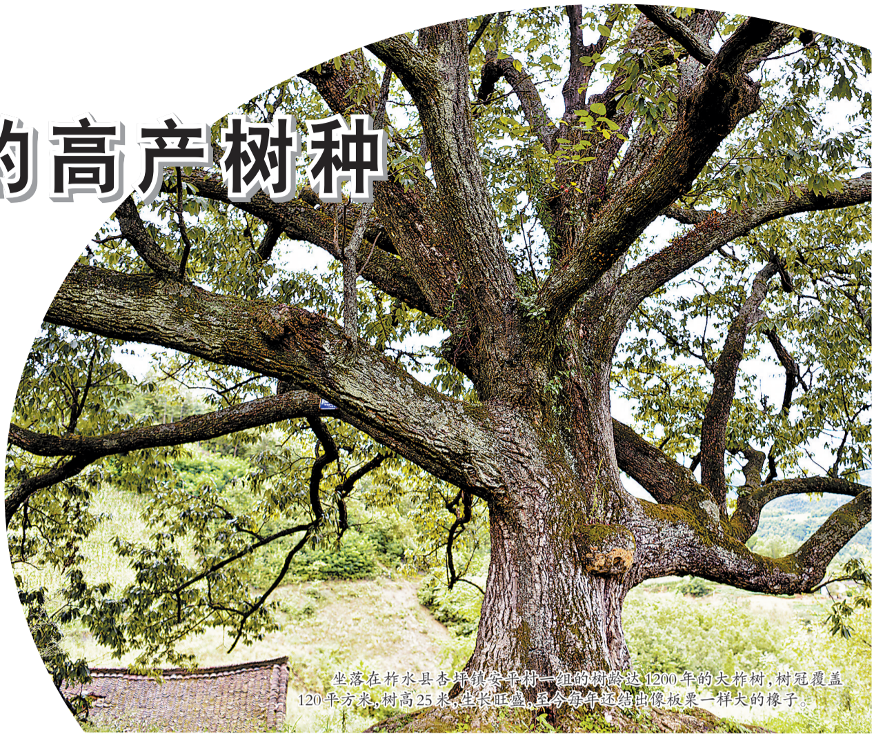
坐落在柞水县杏坪镇安平村一组的树龄达1200年的大树,树冠覆盖120平方米,树高25米,生长旺盛,迄今每年还结出像板栗一样大的橡子。

2020年4月20日,习近平总书记到商洛市柞水县考察调研,在小岭镇金米村袋料木耳大棚向干部群众了解木耳生产情况,点赞“小木耳、大产业”。此后,柞水木耳一路畅销,闻名全国。