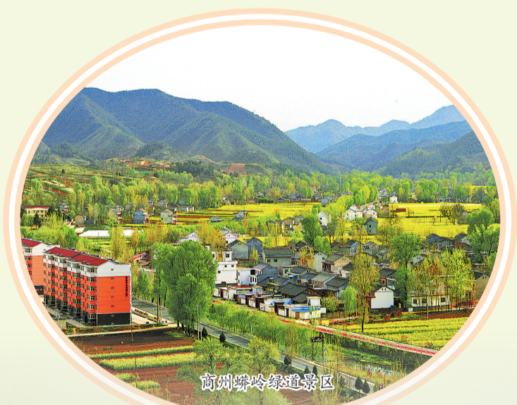
商州蟒岭绿道景区

最后,着重发布3条精品旅游线路。一是商於古道生态文化旅游线路。游汉字故里音乐小镇、生态走廊蟒岭绿道、平凹老家棣花古镇、水旱码头龙驹寨、三秦要塞武关遗址、生态王国金丝峡、住望山居、暮光山院。二是秦风楚韵旅游体验线路。游丹江源头秦岭江山、天柱摩霄天竺山、商贸古镇漫川关、梯田跌宕法官原乡、住丹青吊脚楼、天竺山养生度假小镇。三是秦岭山水休闲旅游线路。游天然氧吧牛背梁、西北一绝柞水溶洞、网红打卡地终南山寨、万仞绝顶塔云山、天开画卷卷王山,住阳坡院子、童话谷。秦岭最美是商洛!22℃商洛·中国康养之都欢迎您!