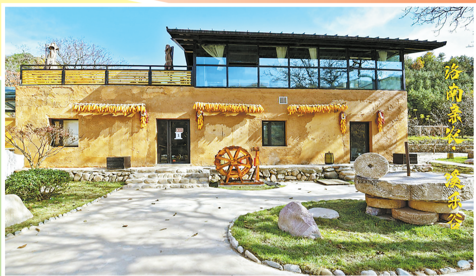
洛南县亲农·溪乐谷