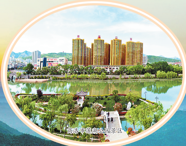
商洛市莲湖公园景区