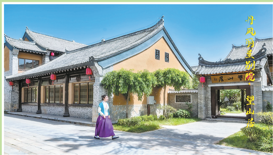
丹凤县丽呈别院·望山居