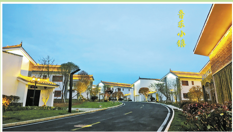
洛南县音乐小镇民宿