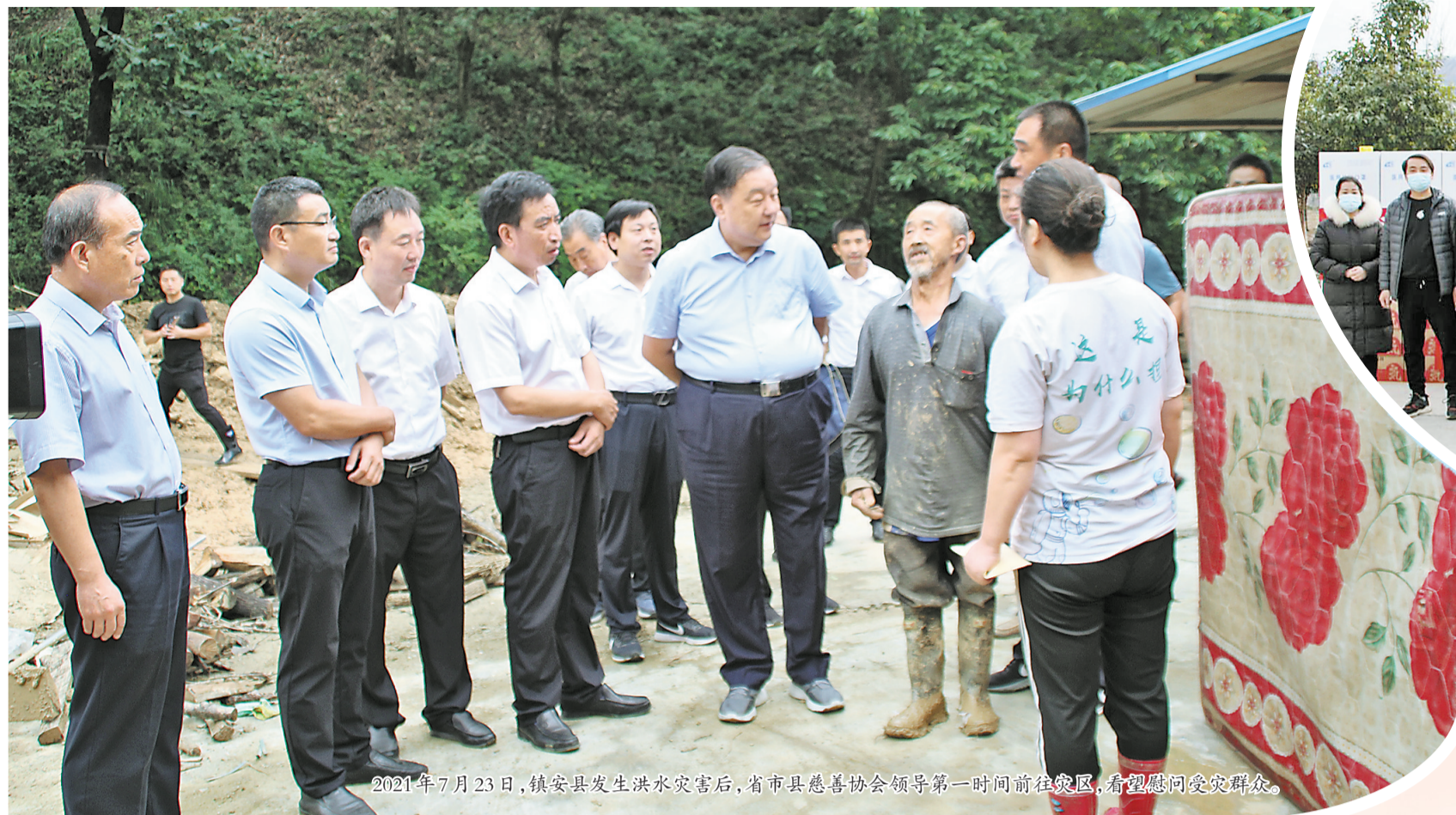
2021年7月23日,镇安县发生洪水灾害后,省市县慈善协会领导第一时间前往灾区,看望慰问受灾群众。