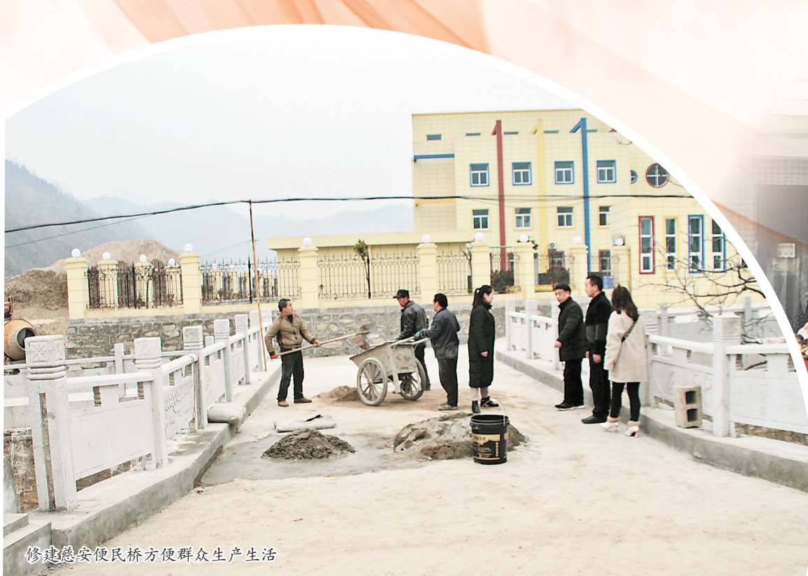
修建便民桥方便群众生产生活

革命精神,深化党史学习教育成果。组织全体工作人员认真学习习近平总书记来陕重要讲话重要指示,庆祝建党一百周年上的讲话以及十九届六中全会精神,增强了干部职工干事创业的责任感、使命感。制定和完善了财务、公文处理、人事管理、会长办公会议规则等七项制度,确保慈善协会工作有章可循。