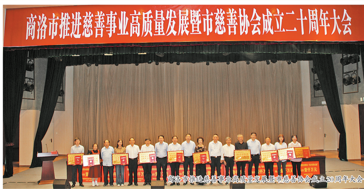
商洛市推进慈善事业高质量发展暨市慈善协会成立20周年大会

2021年是“十四五”开局之年,这一年,商洛市慈善协会工作迈出至关重要的一步。这一年,协会在网络募集善款、幸福家园创建、慈善项目实施、抗疫救灾解困、助力乡村振兴等方面取得了显著成绩。全年共募集款物6406.88万元,交出了一份温暖人心的民生答卷。