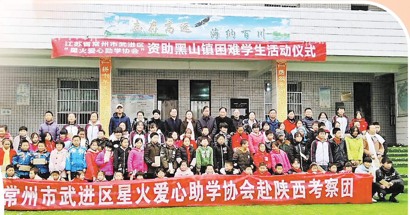
常州市武进区“星火爱心助学协会”连续13年在商洛开展助学活动