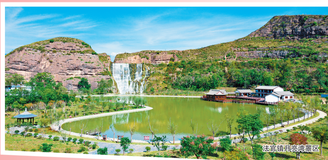
法官镇明泉湾景区