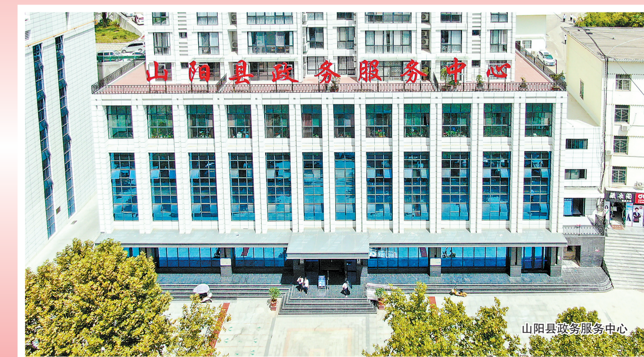
山阳县政务服务中心