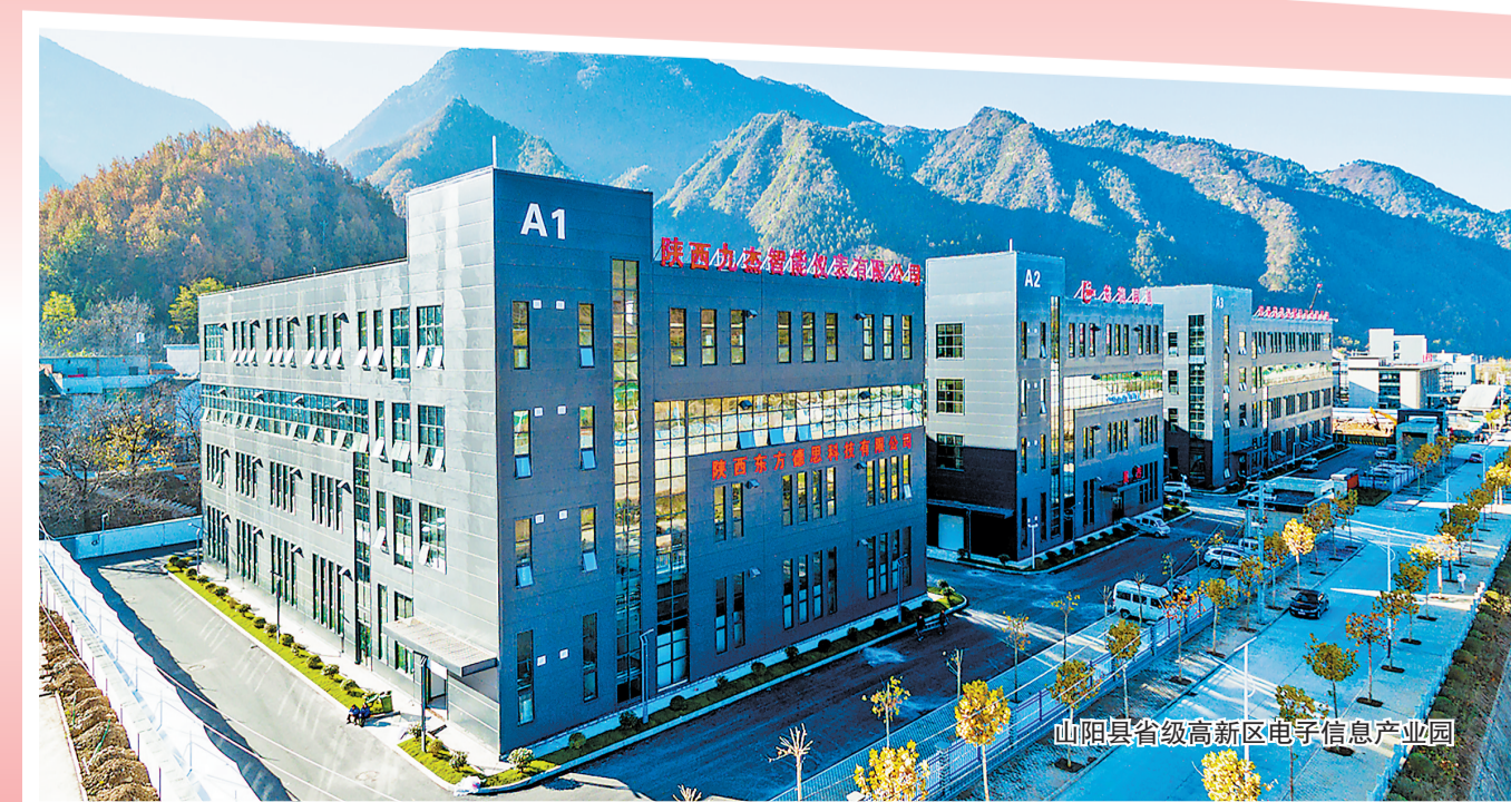
山阳县省级高新区电子信息产业园