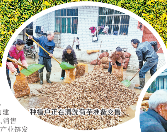
种植户正在清洗菊芋准备交售