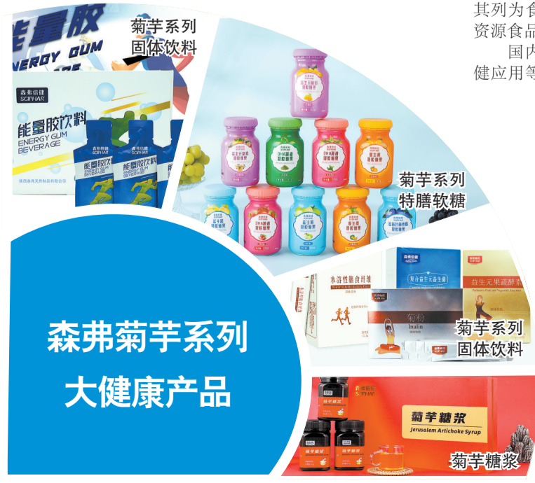
森弗菊芋系列 大健康产品