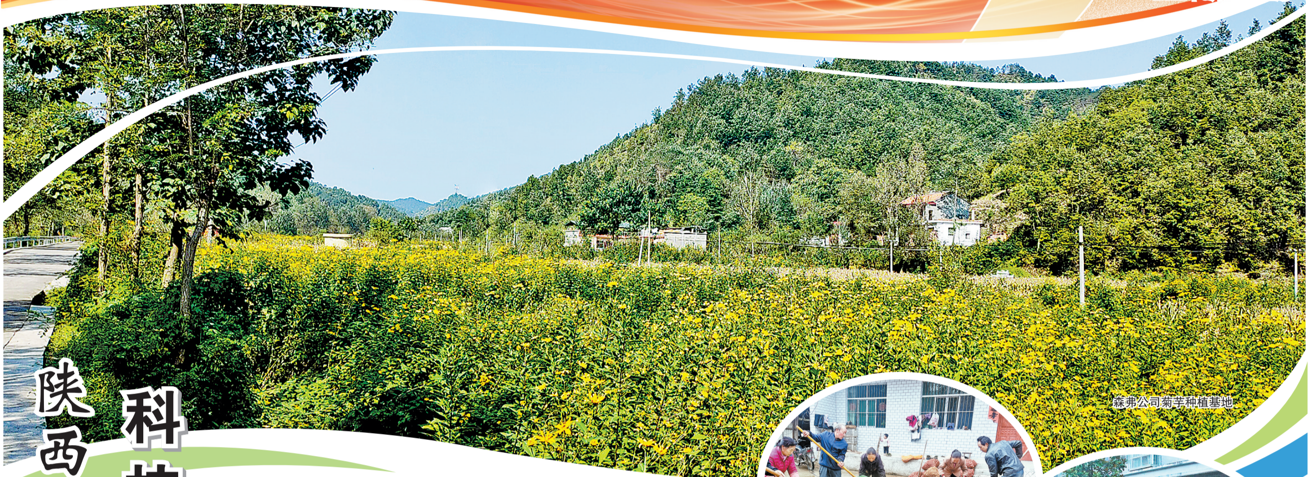
森弗公司菊芋种植基地