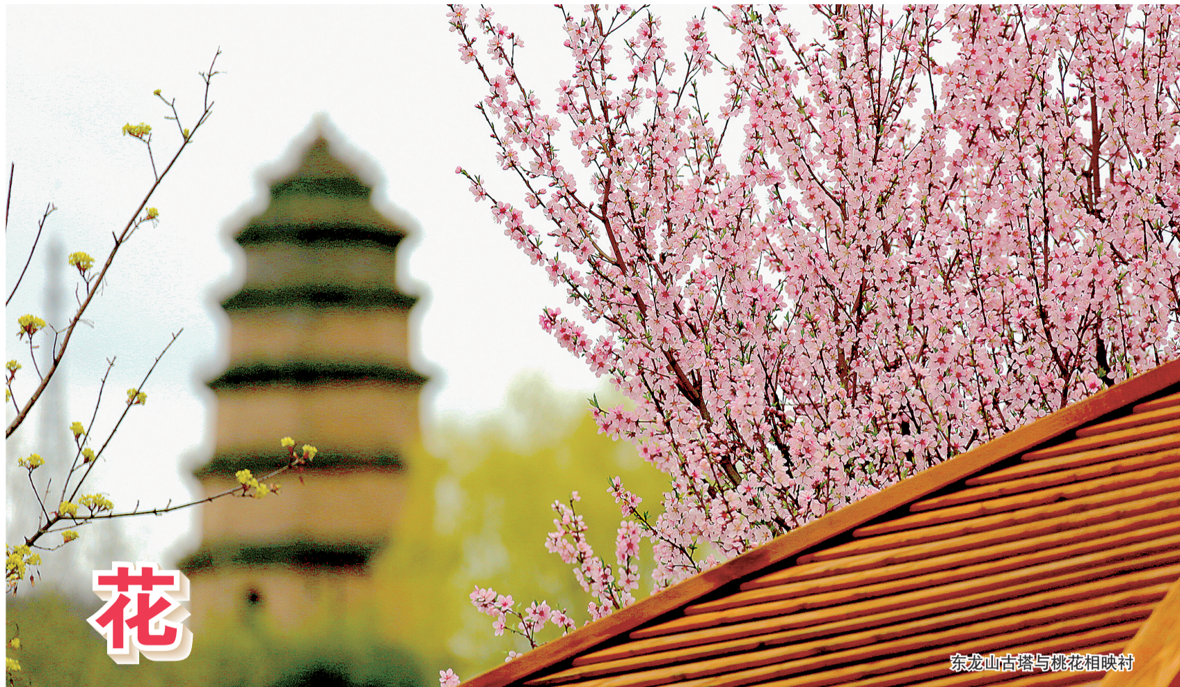
东龙山古塔与桃花相映衬