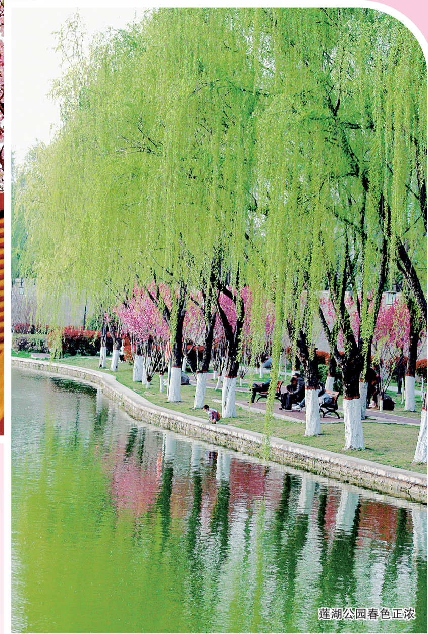
莲湖公园春色正浓