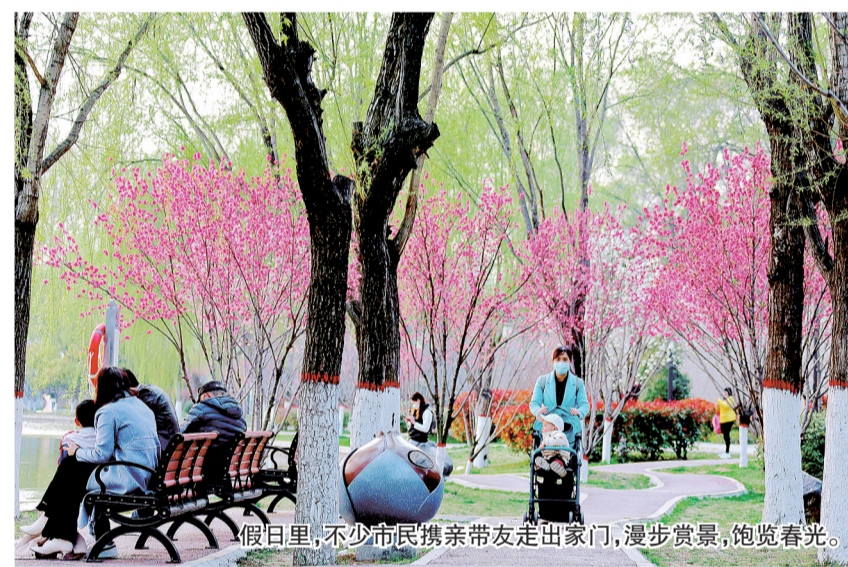
假日里,不少市民携亲带友走出家门,漫步赏景,饱览春光。