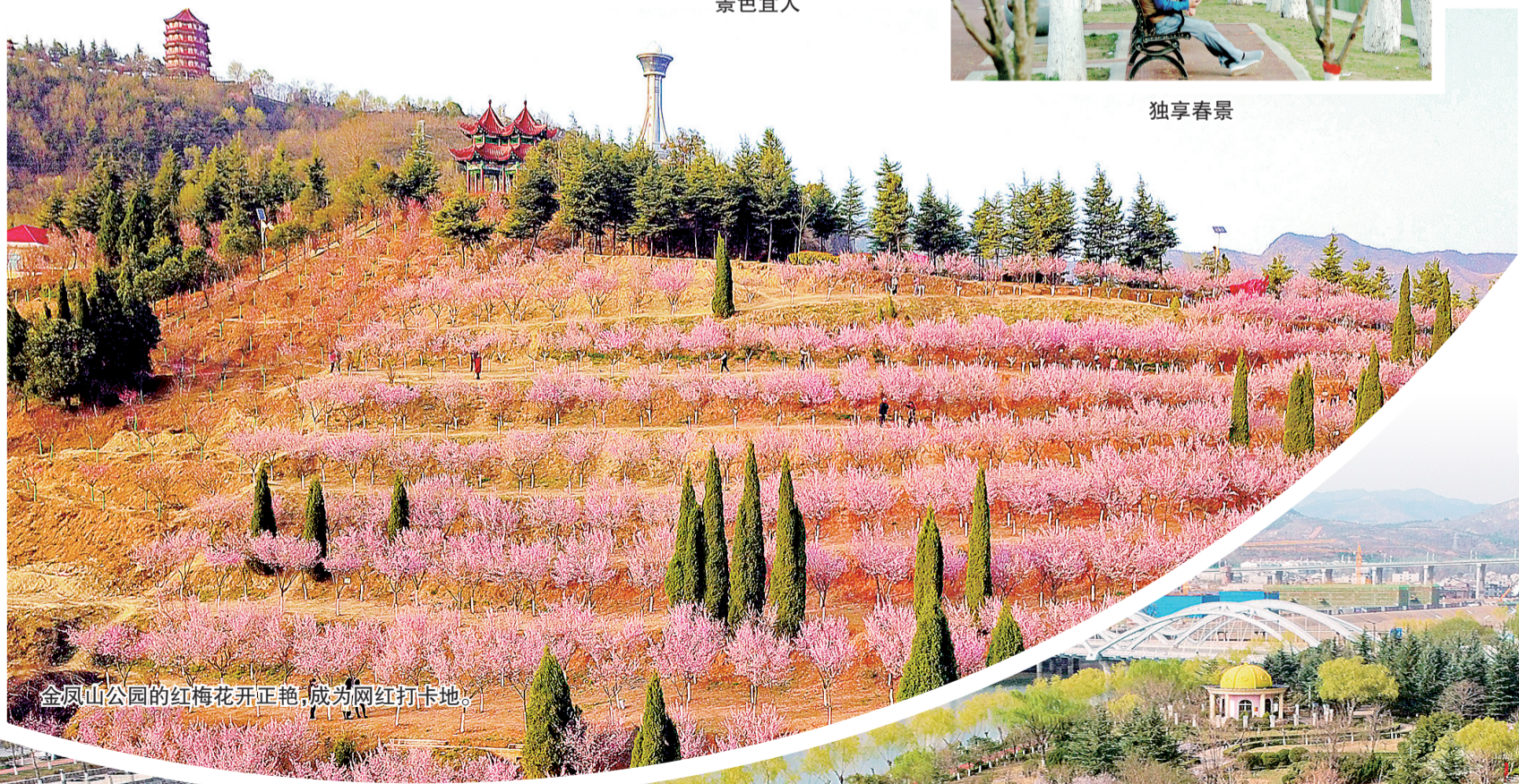
金凤山公园的红梅花开正艳,成为网红打卡地。