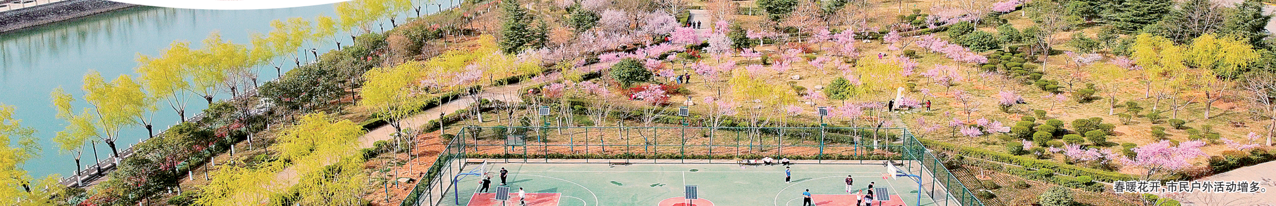
春暖花开,市民户外活动增多。