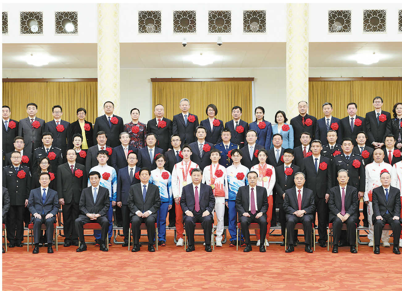
4月8日，北京冬奥会、冬残奥会总结表彰大会在北京人民大会堂隆重举行。会前，习近平等会见北京冬奥会、冬残奥会突出贡献集体代表、突出贡献个人和中国体育代表团成员，并同大家合影留念。

新华社北京4月8日电 北京冬奥会、冬残奥会总结表彰大会8日上午在人民大会堂隆重举行。中共中央总书记、国家主席、中央军委主席习近平出席大会并发表重要讲话。习近平强调，伟大的事业孕育伟大的精神，伟大的精神推进伟大的事业。北京冬奥会、冬残奥会广大参与者珍惜伟大时代赋予的机遇，在冬奥申办、筹办、举办的过程中，共同创造了北京冬奥精神。北京冬奥精神就是胸怀大局、自信开放、迎难而上、追求卓越、共创未来。我们要大力弘扬北京冬奥精神，以更加坚定的自信、更加坚决的勇气，向着实现第二个百年奋斗目标奋勇前进，向着实现中华民族伟大复兴的中国梦奋勇前进。