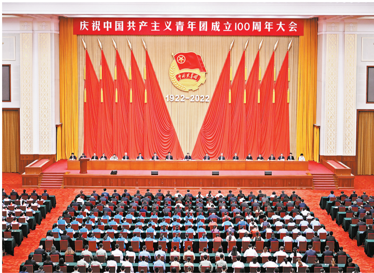
5月10日，庆祝中国共产主义青年团成立100周年大会在北京人民大会堂隆重举行。

新华社北京5月10日电 庆祝中国共产主义青年团成立100周年大会10日上午在北京人民大会堂隆重举行。中共中央总书记、国家主席、中央军委主席习近平在会上发表重要讲话强调，青春孕育无限希望，青年创造美好明天。新时代的中国青年，生逢其时、重任在肩，施展才干的舞台无比广阔，实现梦想的前景无比光明。实现中国梦是一场历史接力赛，当代青年要在实现民族复兴的赛道上奋勇争先。共青团要牢牢把握培养社会主义建设者和接班人的根本任务，坚持为党育人、自觉担当尽责、心系广大青年、勇于自我革命，团结带领广大团员