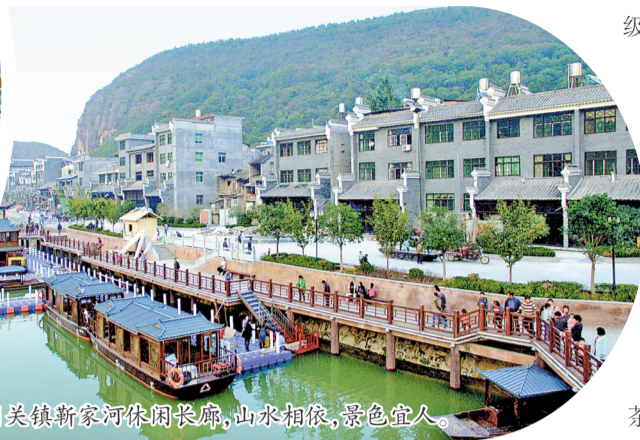
图为漫川关镇新架河休闲长廊,山水相依,景色宜人。

级旅游度假区,漫川古镇、漫川人家成功创建为国家4A级景区、小河口水上乐园创建为国家3A级景区。”