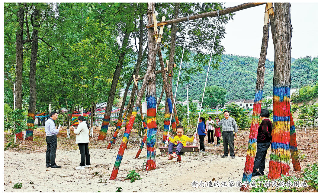
新打造的汪家院子成了村民的休闲地。

去年以来,在商洛日报社驻村工作队的帮助下,二郎庙村制定了乡村振兴五年规划,将香菇、茶叶、乡村休闲游三大产业作为主攻方向,村上按照“长短结合、以短养长”的思路,打好多产融合发展“组合拳”,