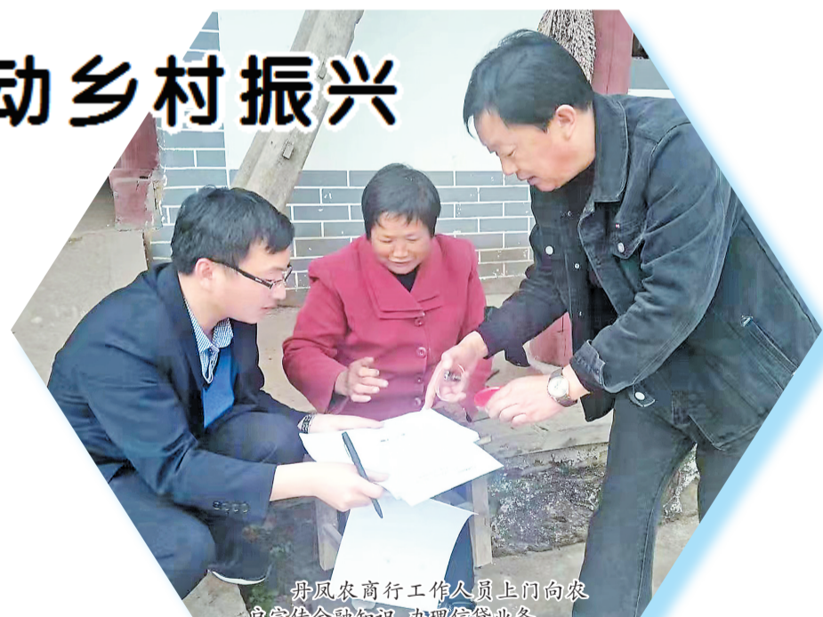
丹凤农商行工作人员上门向农户宣传金融知识,办理信贷业务。

用精细化的措施,护航乡村振兴。丹凤农商银行建立多形式的人才培养体系,通过知识技能比武、全员素质素质拉练、重点人才继续教育再提升等,为乡村振兴和农商行高质量发展提供人才保障;借助信息科技手段,引入风险评估模型,将风险控制前移,定期对业务经营活动进行风险分析评估,从源头上规避业务经营风险;积极和相关