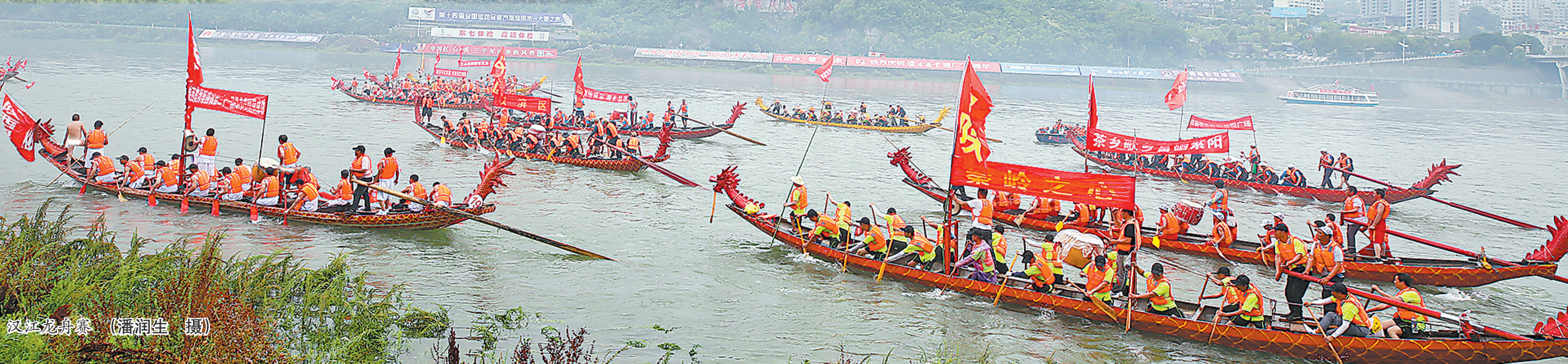
汉江龙舟赛