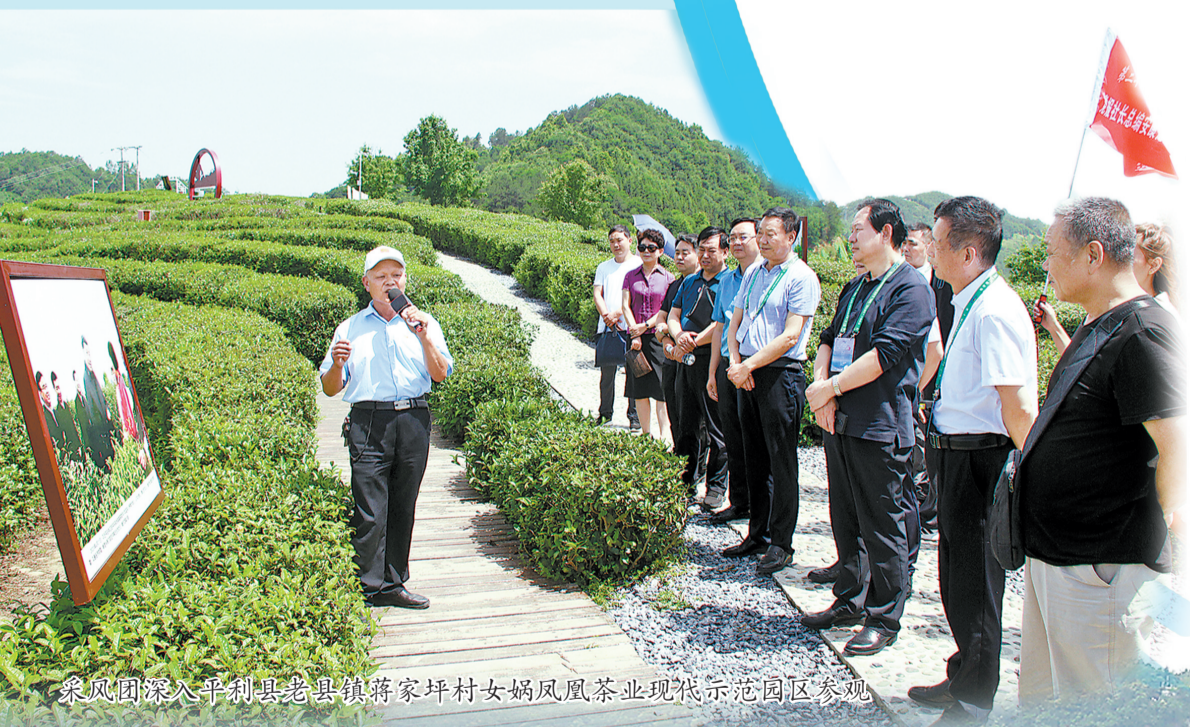
采风团深入平利县老县镇蒋家坪村女蜗风凰茶业现代示范园区参观

秦巴山下，汉水之滨，六月的安康清灵秀美，生态宜人。6月5日至6日，全省地市“党报社长总编安康龙舟行”采风活动圆满举办，来自全省各地市党报的社长、总编齐聚一堂，交流研讨、共话发展、共谋未来，并开展了丰富多彩的采风活动。 6月5日晚，全省地市党报社长、总编相聚安康龙舟文化园，共同参与“国风·汉江辞汇”主题活动，全方位感受安康大地的生态之美、人文之美、发展之美。6日上午，与会嘉宾围绕“媒体与网络建设如何更好更快地融合发展”进行了广泛研讨，并共同签署“全省地市党报战略合作框架协议”，以实现互惠互利、优势互补、合作共赢，推动共同发展。 签约仪式结束后，采风团深入平利县老县镇蒋家坪村女蜗风凰茶业现代示范园区和锦屏社区，沿着两年前习近平总书记来这里考察调研的足迹，用心体悟习近平总书记的殷殷嘱托，激发起