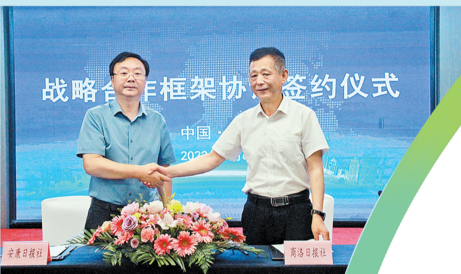
签署“全省地市党报战略合作框架协议”