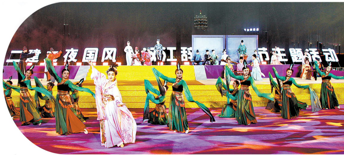
“国风·汉江辞汇”龙舟节文艺演出