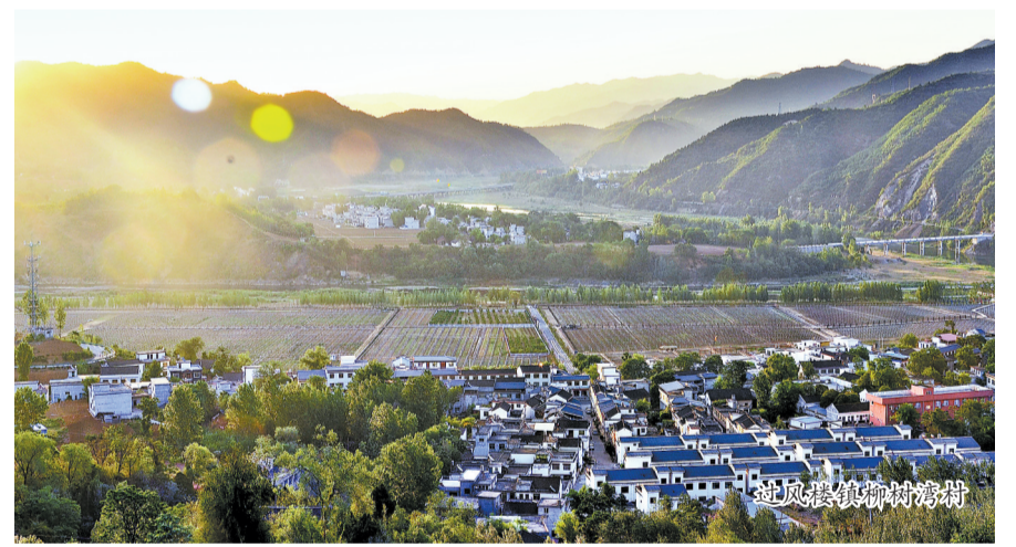
过风楼镇柳树湾村

创新乡村社会治理。该县探索推行“人盯人+”社会治理机制,在县城南大街社区建成了“人盯人+”基层社会治理信息平台,运用视联网,将县上指挥部与全县10个乡镇、126个村社区连接起来,实现了多个治理目标。其中,防返贫监测方面,借助手机客户端视频连线,调度指导村级网格员入户查验农户收入、“两不愁三保障”和饮水安全、突发事故等返贫致贫风险,按程序识别纳入监测对象,跟踪开展帮扶工作,确保不出现返贫致贫现象;治安联防方面,接入全县视频监控,做到了全域覆盖、全网共享、全时可用、全程监控,能够做好特殊人群、关键部位监测,发现上报社会治安隐患,及时防范并精准打击。运用这个信