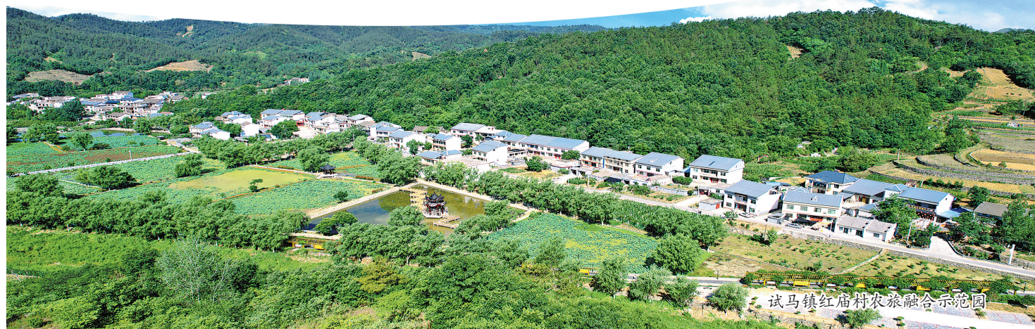
试马镇红庙村农旅融合示范园