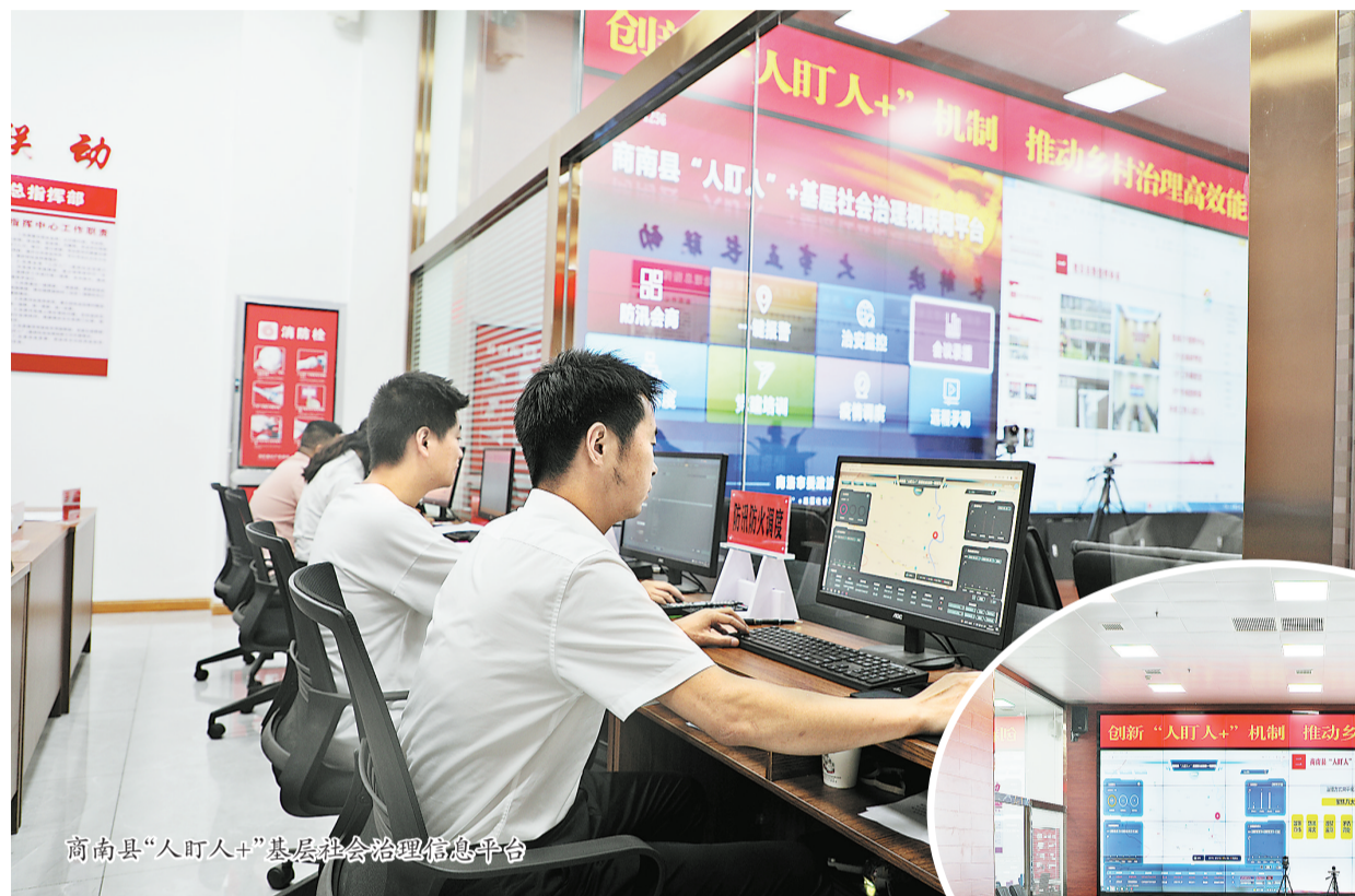
商南县“人盯人+”基层社会治理信息平台