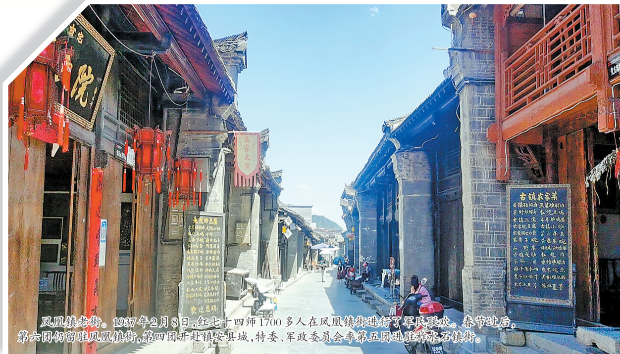
凤凰镇老街。1937年2月8日，红七十四师1700多人在凤凰镇街进行了军民联欢。春节过后，第六团仍留驻凤凰镇街，第四团开赴镇安县城，特委、军政委员会率第五团进驻柞水石砭镇街。

1936年12月12日，西安事变爆发。国民党统治集团内部，各个派别之间本来存在着的矛盾和斗争迅速激化。亲日派何应钦掌握了国民党的军事大权，准备发动大规模内战，牺牲蒋介石以换取取而代之。他们打着“讨伐叛逆”的旗号，大规模调动兵力，向西安逼近，扬言“要炸平西安”。全国形势急剧紧张起来。