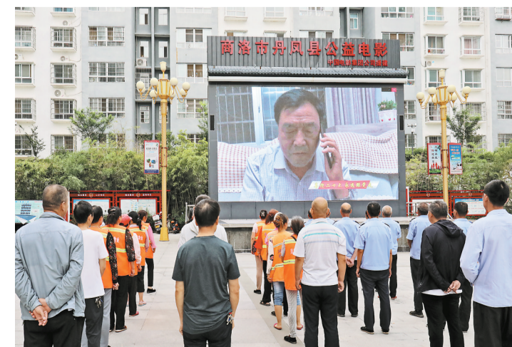
今年以来，丹凤县大力开展优秀远程教育节目进广场、进互联网、进电视、进企业、进党性教育课堂等“五进”活动，打破传统的远程教育节目学习形式，深受广大党员群众的欢迎。

民警提醒：如在野外发现珍稀保护动物，请及时联系政府相关部门或拨打110请求支援，违法捕获、猎杀、贩卖、食用野生动物将受到法律制裁。