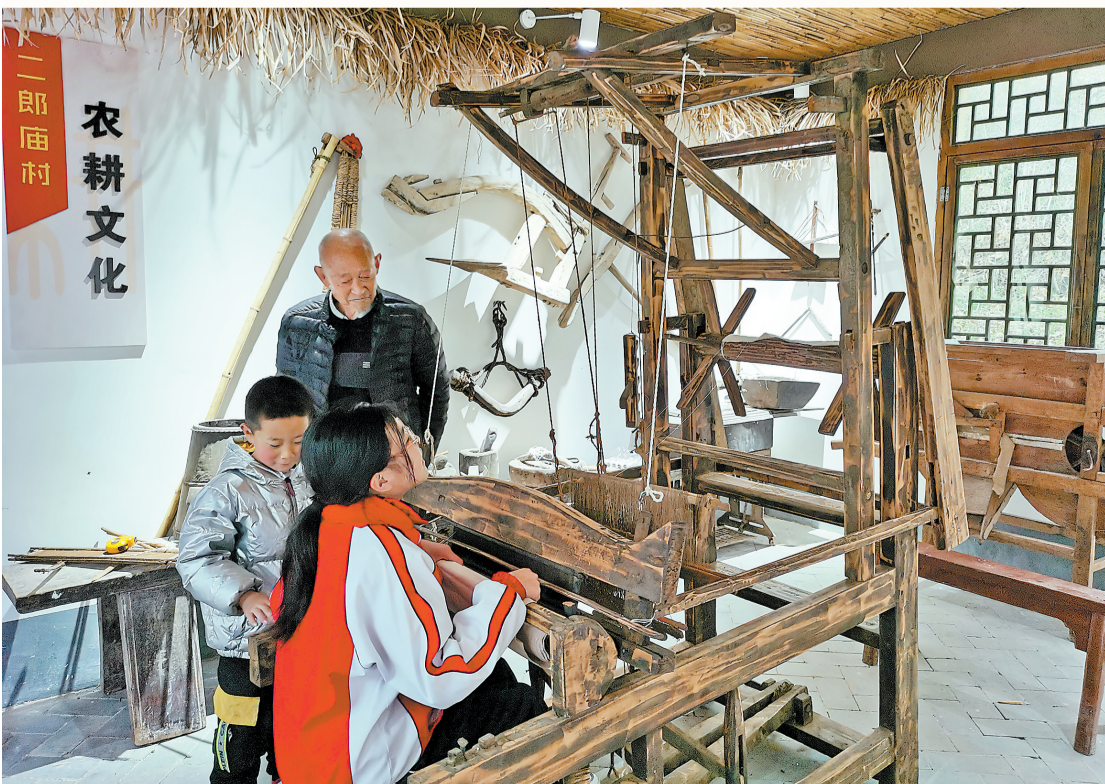
难得一见的织布机