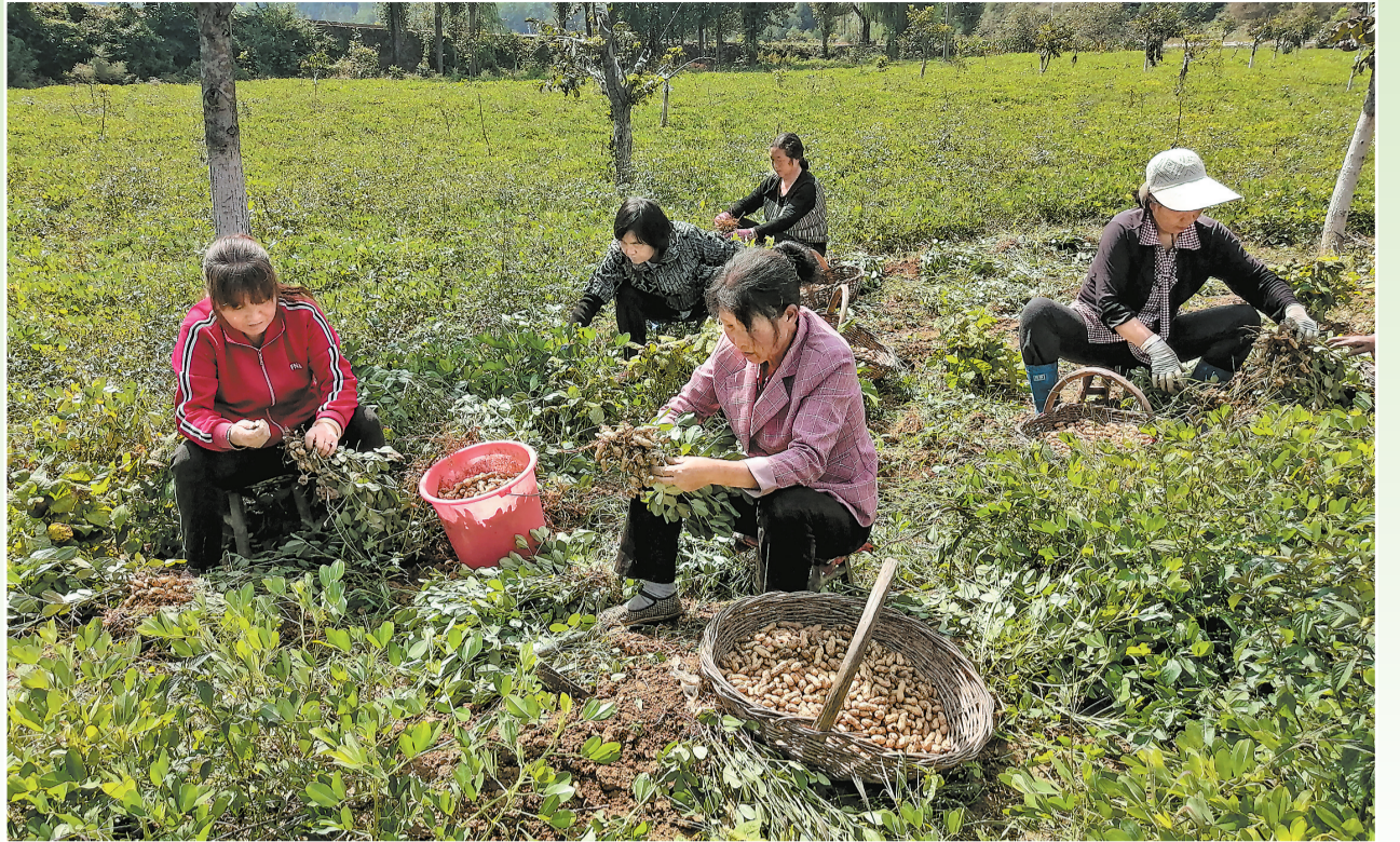
9月15日,在洛南县石坡镇周湾村黑花生产业基地里,村民正在抢抓黑花生,一串串颗粒饱满的花生带着泥土的清香,映衬出丰收的美好。黑花生基地的建成,让村民在家门口就能获得劳务机会,增收致富。(本报通讯员 闫伟锋 摄)

“目前,村内乱扔垃圾的人少了,主动维护村容村貌的人多了;好吃懒做的人少了,勤劳致富的人多了;铺张浪费的人少了,文明节俭的人多了。葛条村从脏乱村变成文明村,小小的《村规民约》起到了很大作用。”村党支部书记郭等存高兴地说。