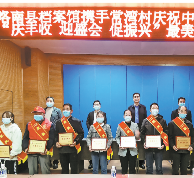
9月23日，是第五个“中国农民丰收节”。洛南县景村镇常湾村党支部联合帮扶单位县档案馆共同举办最美榜样表彰活动。