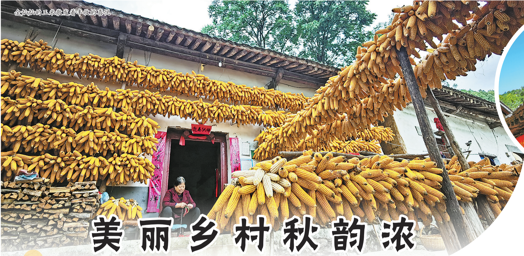
金灿灿的玉米散发着丰收的喜悦