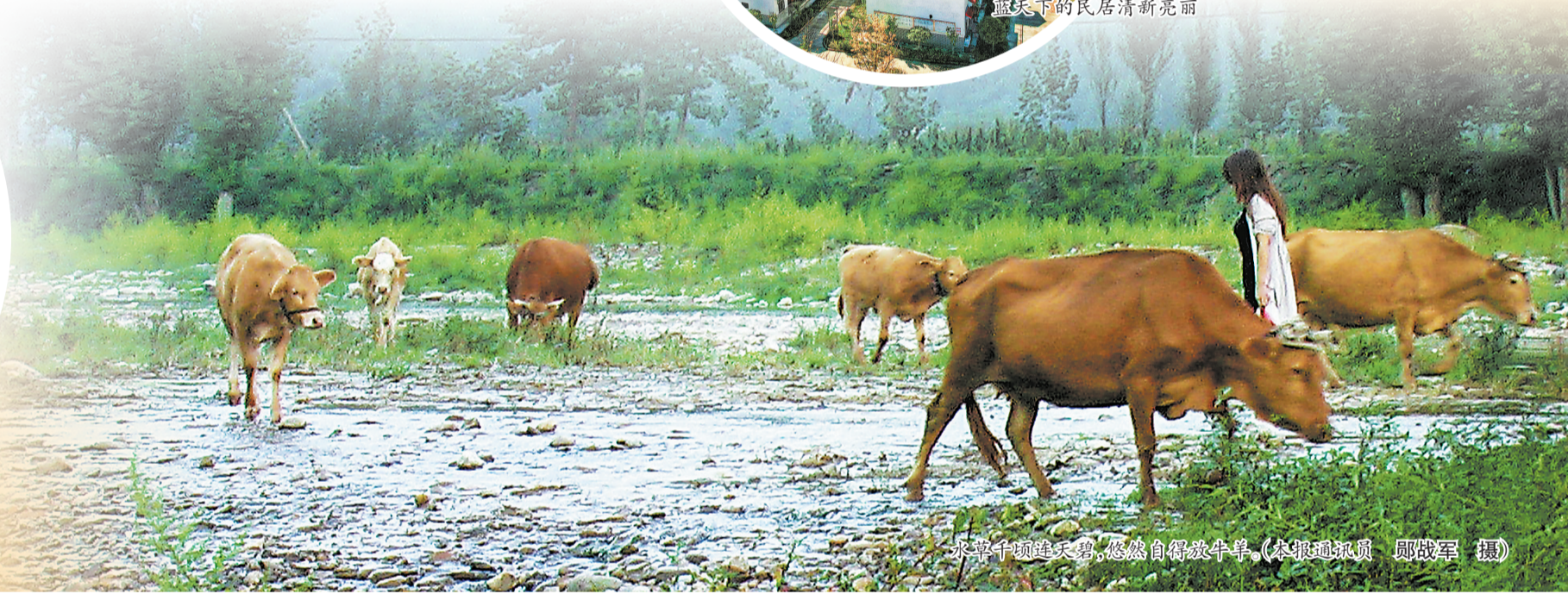
水草丰腴随天碧，悠然自得放牛羊。