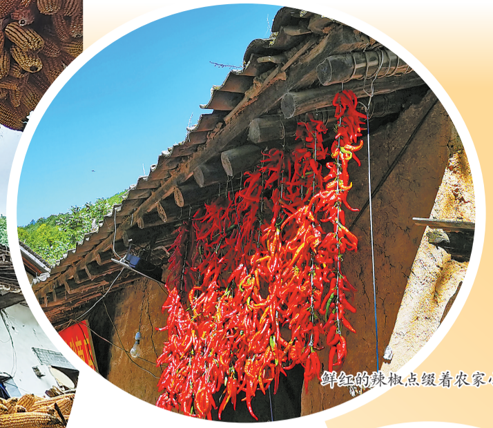
鲜红的辣椒点缀着农家小院