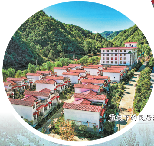
蓝天下的民居清新亮丽