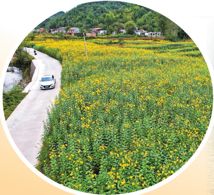
盛开的菊花蕴含着致富的希望