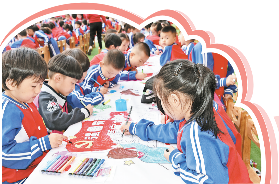
△9月28日，柞水县第一幼儿园开展“国庆长画卷，喜迎二十大”活动，孩子们用五彩画笔描绘心中最美的祖国。