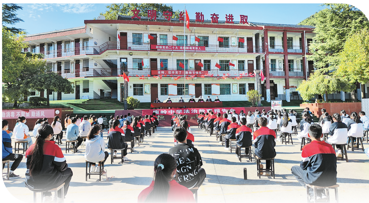
△9月29日下午，丹凤县秦岭中学举行法治教育报告会，以别样的形式欢度国庆，筑牢校园安全防线。