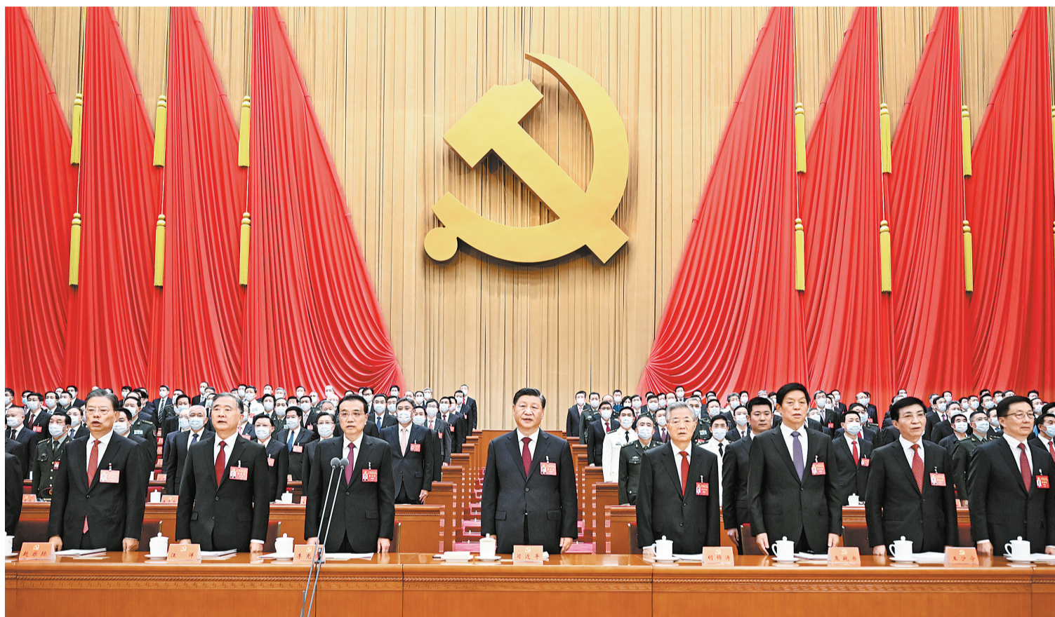
10月16日，中国共产党第二十次全国代表大会在北京人民大会堂开幕。这是习近平、李克强、栗战书、汪洋、王沪宁、赵乐际、韩正、胡锦涛在主席台上。

新华社北京10月16日电 凝心聚力擘画复兴新蓝图，团结奋进创造历史新伟业。举世瞩目的中国共产党第二十次全国代表大会16日上午在人民大会堂开幕。