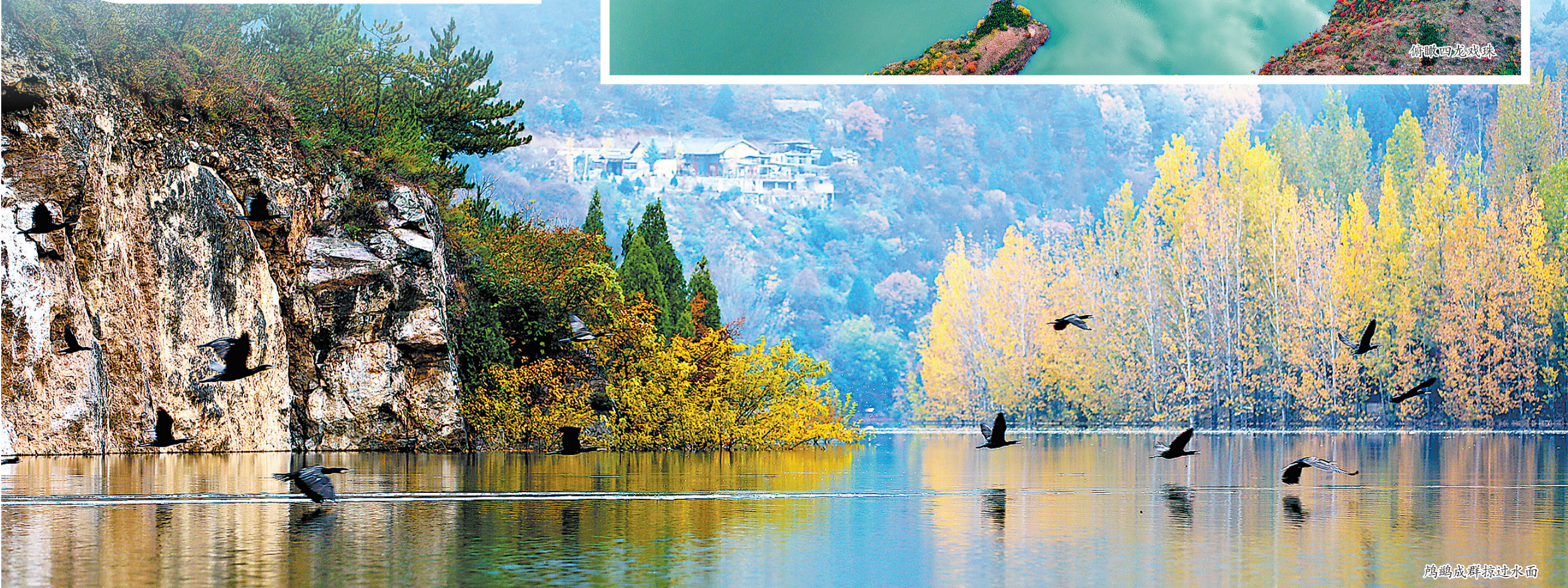
鸬鹚成群掠过水面