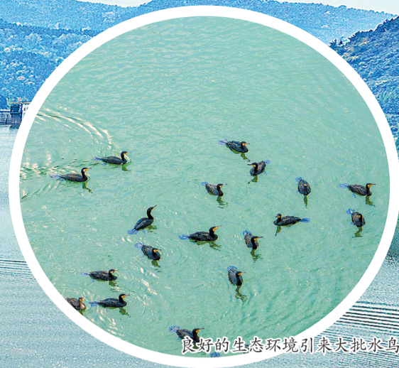
良好的生态环境引来大批水鸟栖息