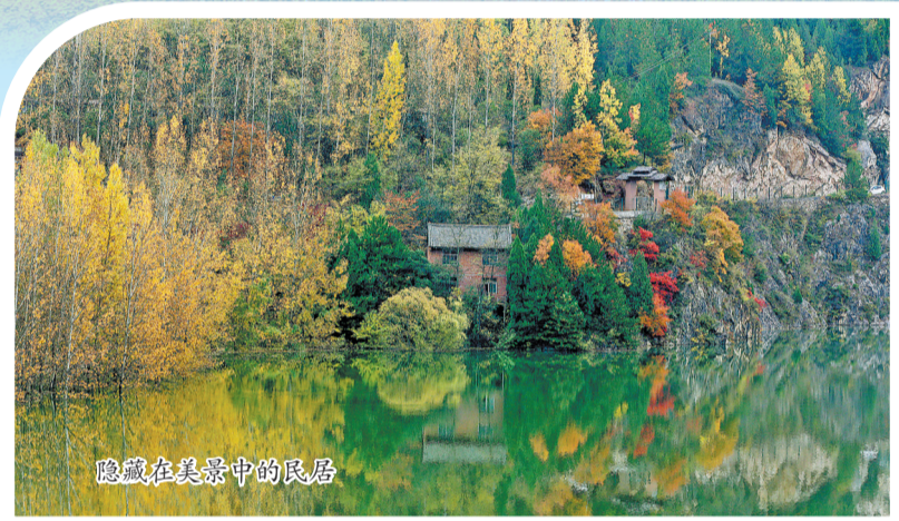
隐藏在美景中的民居