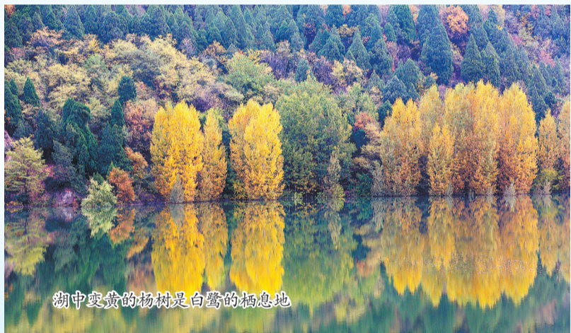
湖中变黄的杨树是白鹭的栖息地