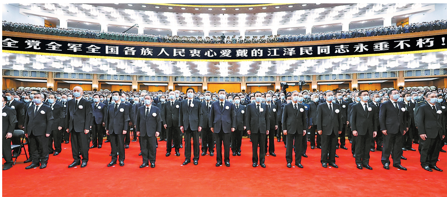
12月6日，中共中央、全国人大常委会、国务院、全国政协、中央军委在北京人民大会堂隆重举行江泽民同志追悼大会。习近平、李克强、栗战书、汪洋、李强、赵乐际、王沪宁、韩正、蔡奇、丁薛祥、李希、王岐山等参加大会。