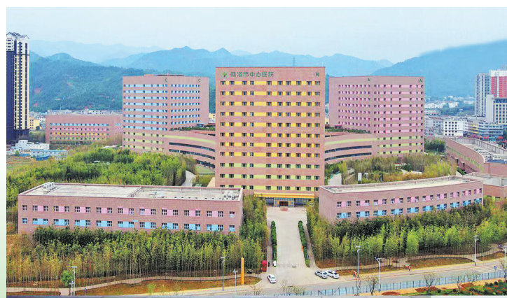
商洛市中心医院新院区项目

商洛市妇幼保健院迁建项目位于北新街西段60号(商洛职业技术学院原附属医院旧址),占地约37亩。一期工程对门诊楼、住院楼及配套设备进行维修提升,完成儿科急诊楼拆除、室内1.1万平方米改造装修装饰,室外7855平方米场地绿化美化,已于2022年1月搬迁开诊。改造后的新院区服务设施更完善,环境更优美,流程更规范,大大改善了患者的就诊条件,标志着全市妇幼卫生健康事业迈上高质量发展的新起点。二期计划将建成一所集医疗、保健、教学、科研、康复为一体的三级甲等妇幼保健院。