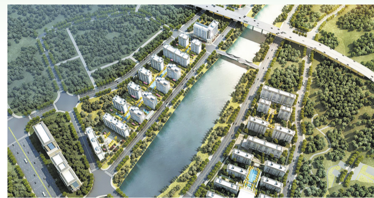
仙娥湖片区道路桥梁工程

环城西路项目是市委、市政府确定的中心城市重点建设项目。项目南起242国道,北至构峪口加油站,全长约4050米,红线宽度40米,双向6车道,设计时速为50千米每小时。项目分两期建设,一期工程203省道至马莲峪路立交已于2019年9月26日建成通车,二期工程马莲峪路立交至构峪口段正在建设中。该项目建成后将打通城市环线,连接242与312国道,对于优化城市南北交通、促进区域经济发展具有重要意义。