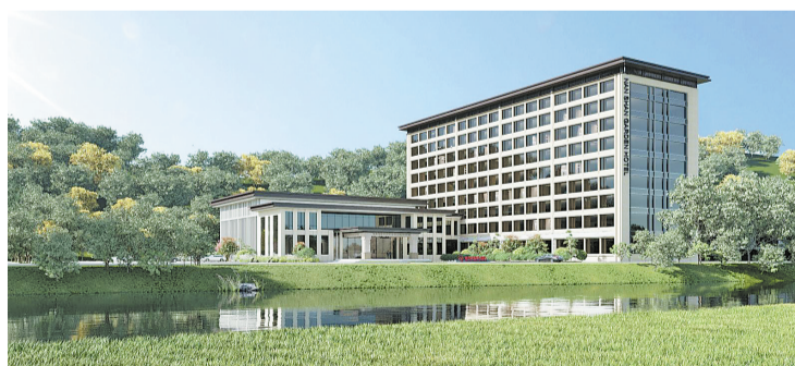
南山花园精品酒店及配套项目

商洛悦豪酒店位于商鞅大道东段,是按照五星级标准筹建的以“娱乐+游乐”为特色的休闲度假酒店,每层装修风格均有不同,一步一景、处处为景,必将成为自带流量的网红打卡地。酒店配备客房156间,有容纳近400人的宴会厅、容纳近200人的全日制生态餐厅和2个多功能会议室。酒店建成后将极大丰富商洛的旅游业态,壮大商洛星级酒店集群。