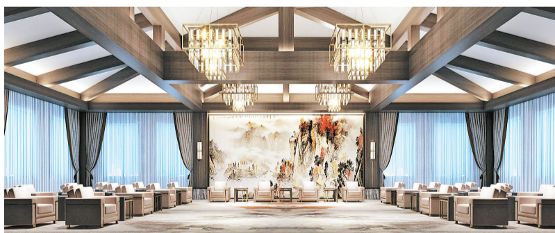
商洛悦豪酒店项目

商洛悦豪酒店位于商鞅大道东段,是按照五星级标准筹建的以“娱乐+游乐”为特色的休闲度假酒店,每层装修风格均有不同,一步一景、处处为景,必将成为自带流量的网红打卡地。酒店配备客房156间,有容纳近400人的宴会厅、容纳近200人的全日制生态餐厅和2个多功能会议室。酒店建成后将极大丰富商洛的旅游业态,壮大商洛星级酒店集群。