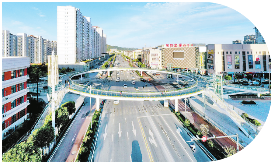
商州区第六小学人行天桥

商州区第六小学人行天桥位于商鞅大道与新洛路十字路口,桥梁整体呈椭圆形,主桥设计采用钢箱梁结构,桥宽4米,全长198米,四周设置梯、坡道,配备垂直电梯、桥体绿化亮化等附属设施。该项目建成投用后将极大缓解商州区第六小学、商州区第十二幼儿园及周边居民小区交通出行压力,进一步完善城市立体交通布局,助力“一都四区”建设。