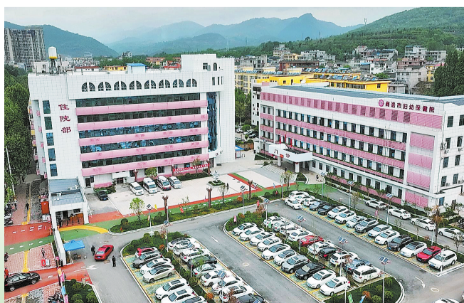
商洛市妇幼保健院迁建项目

商洛皇冠假日酒店项目位于商州西路与商鞅大道交汇处,项目占地面积32亩,总建筑面积约5万平方米,包括餐饮宴会厅、多功能厅、会议室、全日餐厅、健身房、泳池、行政走廊和近300间客房,项目以打造集政务、商务、旅游为一体的五星酒店为使命,落成之日必将成为商洛城市形象重要展示窗口。