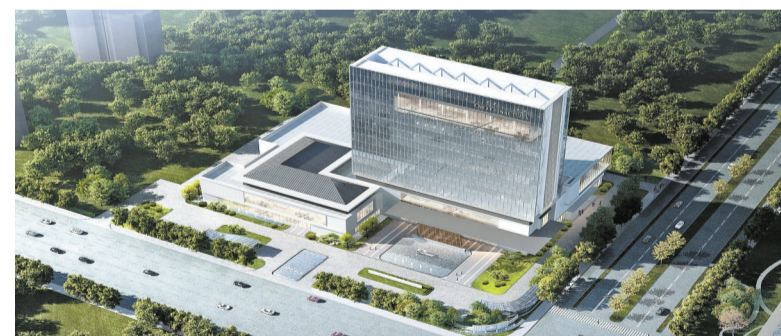
商洛皇冠假日酒店项目

商洛南山花园精品酒店及配套项目位于环城北路二桥以北,东临仙娥湖路,占地约46亩,建筑面积约4.7万平方米,其中酒店区约2.8万平方米,住宅及配套区约1.9万平方米。项目以商洛山地景观和良好生态为依托,旨在打造集培训会议、宴会餐饮、休闲住宿、康养养生于一体的人居生活区和生态商务区,将进一步促进新型城镇化建设,增强区域经济。