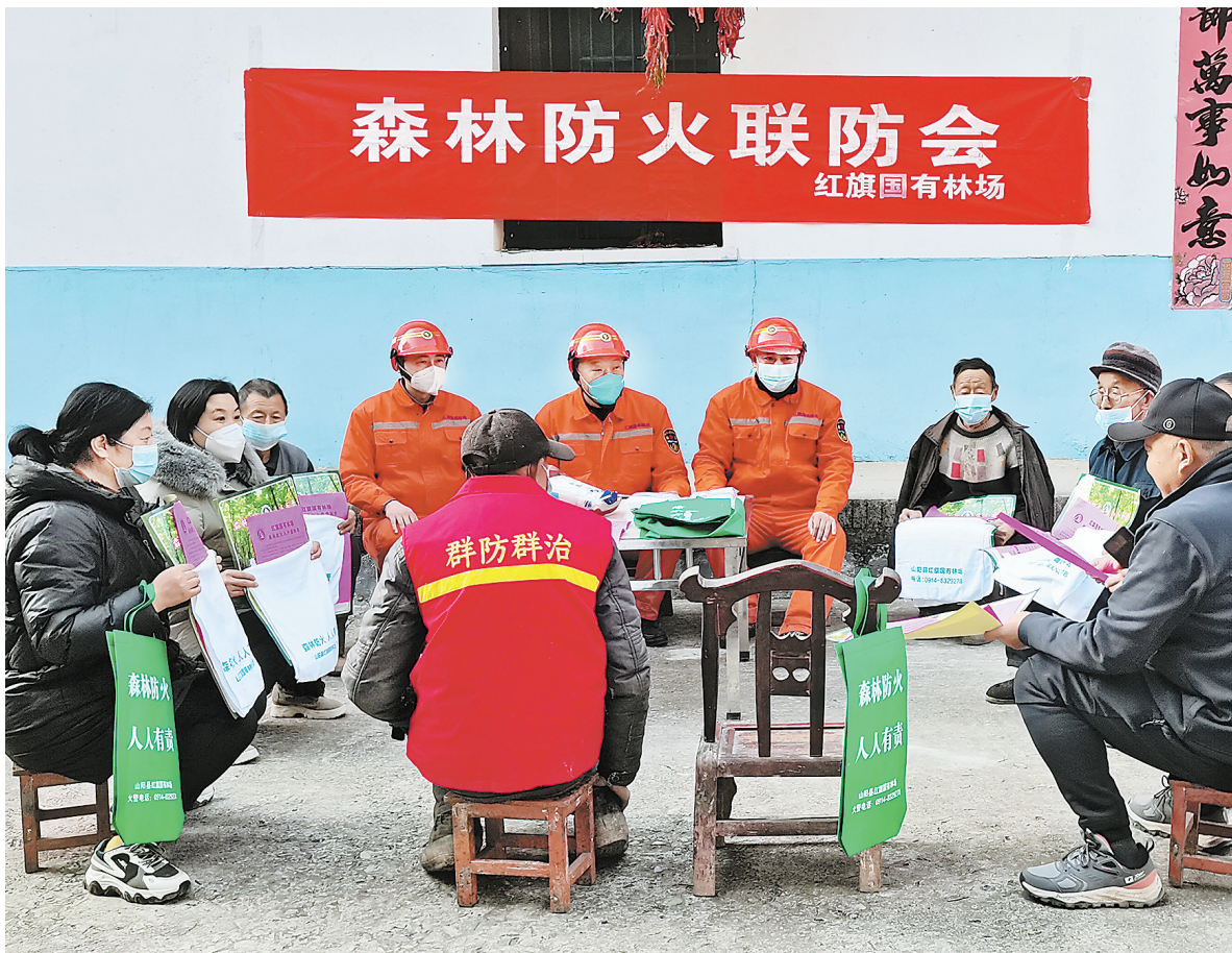
12月14日，山阳县红旗国有林场工作人员走进森林管护区内的色河铺镇峪口村，开展森林防火联防庭院会，向护林员和群众发放防火宣传单，现场讲解森林防火常识，切实提高群众森林防火意识。（本报记者 王倩 摄）

涵养校园文化。商州区深入推进“廉洁文化进校园”活动，在德育课堂中增加廉洁教育内容，借助校报校刊、校园网站、班级板报等阵地，开设符合学生心理特点的专栏、专题，广泛传播廉政知识，弘扬廉洁文化。扎实开展形式多样、丰富多彩的清廉教育活动，商州区职业高级中学在教师中开展清廉教师研讨会，区第五小学利用学校微信公众号开设清廉讲堂栏目，区第六小学建立经典文化墙，区人民检察院走进校园开展“扬廉洁清风，建清廉校园”主题讲座……在学生心中植入“廉”种子，让师生在潜移默化中感受“廉”文化的熏陶。