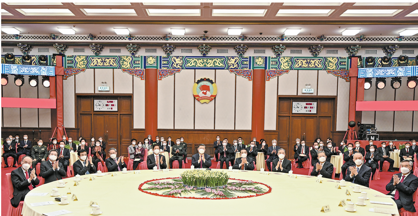
12月30日，全国政协在北京举行新年茶话会。党和国家领导人习近平、李克强、栗战书、汪洋、李强、赵乐际、王沪宁、蔡奇、丁薛祥、李希、王岐山出席茶话会并观看演出。

持中国现代化建设的各国朋友，致以节日的问候和诚挚的祝福。 习近平指出，2022年是党和国家发展史上极为重要的一年。我们胜利召开党的二十大，描绘了全面建设社会主义现代化国家的宏伟蓝图。我们坚持稳中求进工作总基调，全面贯彻新发展理念，推动高质量发展，经济保持增长，粮食喜获丰收，保持就业、物价稳定。我们因时因势优化防控策略，最大限度守护人民生命安全和身体健康，最大限度减少疫情对经济社会发展影响。我们成功举办北京冬奥会、冬残奥会。我们隆重庆祝香港回归祖国25周年。我们对“台独”分裂行径和外部势力干涉进行坚决斗争。我们继续推进中国特色大国外交，维护外部环境总体稳定。这些成绩来之不易，是全党全军全国各族人民团结奋斗、顽强拼搏的结果。