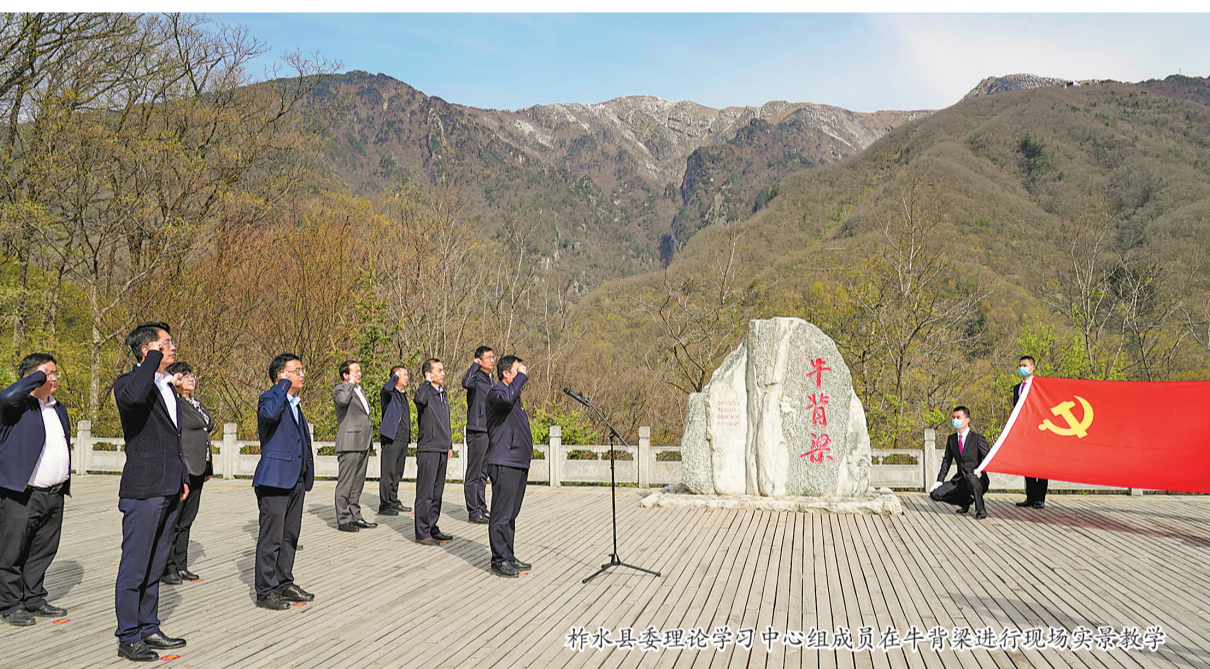
柞水县治理理论学习中心组在牛背梁进行现场实践教学

实施污染防治攻坚战。压紧压实各级林长、河长、田长责任，统筹推进减煤、控车、抑尘、治源、禁燃、增绿，扎实开展县域“1+N”水生态治理，积极创建“无废”城镇，持续巩固小水电和生态环境突出问题整治成果，严格推行生态环保督察反馈问题闭环整改机制，动真碰硬、坚决彻底抓好中央第二轮和省环保督察反馈问题整改，确保所有问题整改见底。