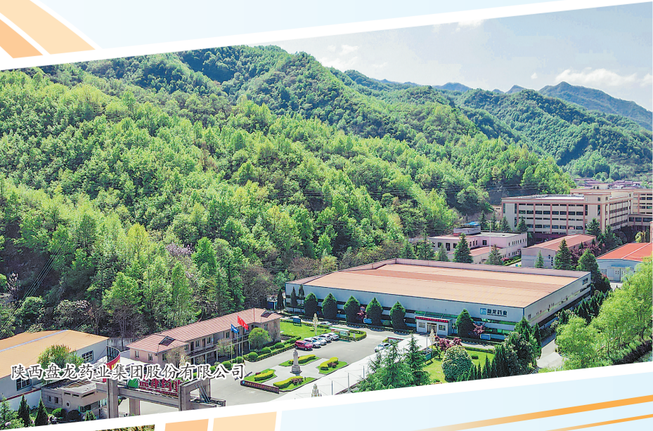
陕西盘龙药业集团股份有限公司