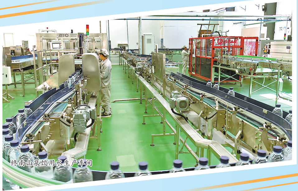
柞水山泉矿泉水生产厂