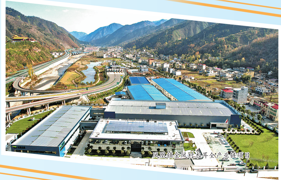
西商国际农特产品交易中心