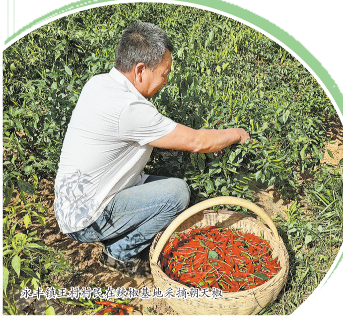
永丰镇豆棚村在辣椒基地采摘朝天椒

践站(所)19个,累计开展政策宣讲、志愿服务、防灾减灾、移风易俗、道德评议等文明实践活动280多场次,充分运用“洛惠渠”英烈奋斗事迹、“老山书屋”红色抗战事迹和“孙增亮志愿服务队”的时代先锋事迹教育人、影响人、感化人、凝聚人,受教育群众1.6万多人,培育市级文明村1个、县级文明村8个;建成永丰镇“新乡贤驿站”,成立“百名乡贤联合会”,设立“优秀乡贤工作室”8个,在传递党的声音同时,通过“新乡贤”定期联席会议共同谋划振兴产业、共同参与社会治理、共同倡导文明新风;统筹运用“人盯人+”基层社会治理1844机制,不定期入户走访,倾听民声、纾解民怨、解决民难,共排查矛盾纠纷906起,调处化解869起,受理交办案件150件。通过多种方式综合运用法治、德治、自治“三治”融合体系,引导教育广大群众听党话、跟党走、感党恩、促振兴、谋幸福。