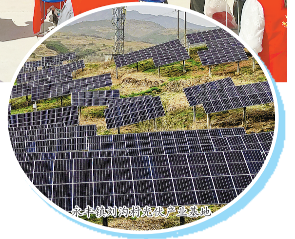
永丰镇刘沟湾光伏产业基地

重点进行绿化,栽植各类绿色苗木8000多株;以307省道为主轴进行亮化,安装路灯940多盏,集镇形象持续提升,商贸活力持续增强。