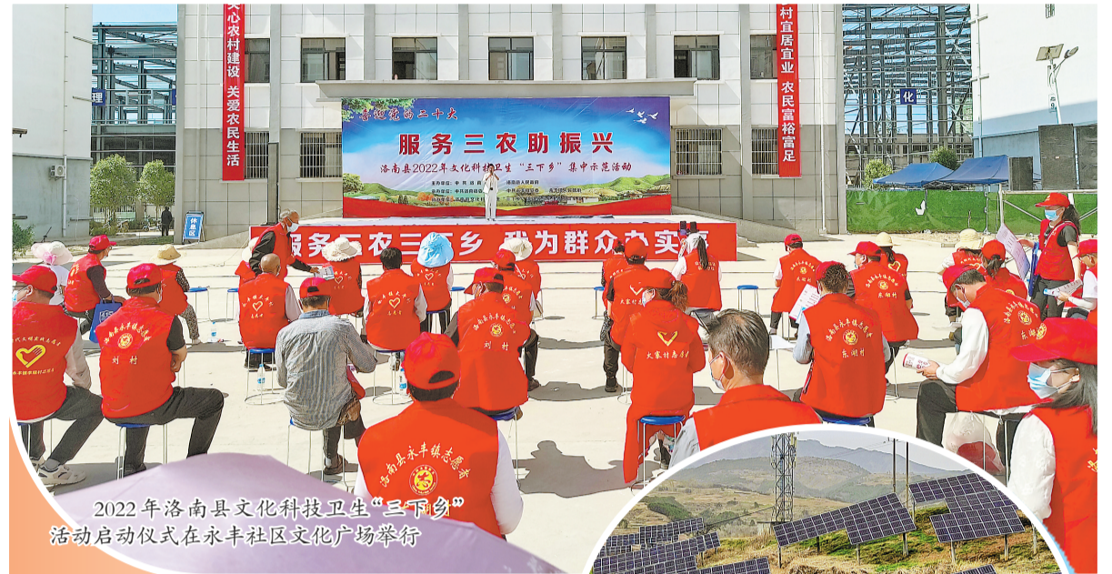
2022年洛南县文化科技卫生“三下乡”活动启动仪式在永丰社区文化广场举行

按照“拉大城镇框架、完善城镇功能、擦亮城镇颜值、提升城镇品位”的思路,以“5432工作法”全力打造洛南西部商贸重镇,下好商贸活镇“一盘棋”。按照“两拆一提升”统一部署,对集镇及周边的乱搭、乱建、乱占、乱贴、乱挂等违规现象进行集中整治,拆除违规广告225块,拆除乱占摊点110多处,拆除违法建筑物5处;高标准建成南新街餐饮一条街、南街服饰一条街、老街商贸一条街、洛洪路过境段背街水暖建材一条街;通过实施“白转黑”新铺设集镇沥青道路2.6万平方米、人行道1.2万平方米,新换商户门头牌匾125块,新建集镇农产品交易市场1个;以集镇为