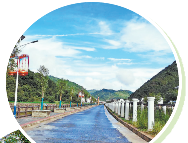
丹凤县商镇镇粮种天麻产业园

立足区域条件，结合农情民情、风俗习惯，多措并举、统筹施策，着力破解农村人居环境整治成果最难巩固、易反弹回潮的问题，实现了“全域整治”向“全域美丽”的华丽蝶变。一是实施网格化整治。聚焦院落、田地、河流、道路、山坡五大重点区域，对所有镇村实施网格化管理，划定整治区域，确定责任领导，明确网格长、网格员，通过“人盯人”的方式，全域整治环境，不留盲区、不漏死角，确保全市秦岭山水乡村建设大见效、大变样、大提升。二是实施精细化提升。坚持因地制宜，突出地域文化特色，不搞大拆大建，也不搞千村一面。鼓励群众在改善环境上下足绣花功夫，通过微改造、精提升，充分利用闲置、废弃边角、交界地块建菜园、花园、果园、竹园、游园，见缝插绿，以细致入微的管理提升整治效果。三是实施常态化巡查。实行市包县、县包镇、镇包村、村包组的层层包抓督查机制，定期沿高速公路国道、省道、县道和河道、督查道路、河流、田园、山坡环境整治和网格责任落实情况，一线明察暗访，现场交办问题，责成问题所在地立行立改，上报整改前后照片并申请实地销号，防止整治回潮现象发生。四是实施矩阵化宣传。大力推行院落总结会、好人表扬会、懒人感化会，宣讲政策，教化思想，示范激励，教育引导群众自己的事自己干。充分利用抖音、微信等全方位宣传秦岭山水乡村建设好经验，树立先进典型，打造示范样板，营造向善向好的良好舆论氛围。五是实施差异化奖惩。健全激励约束制度，坚持“抓两