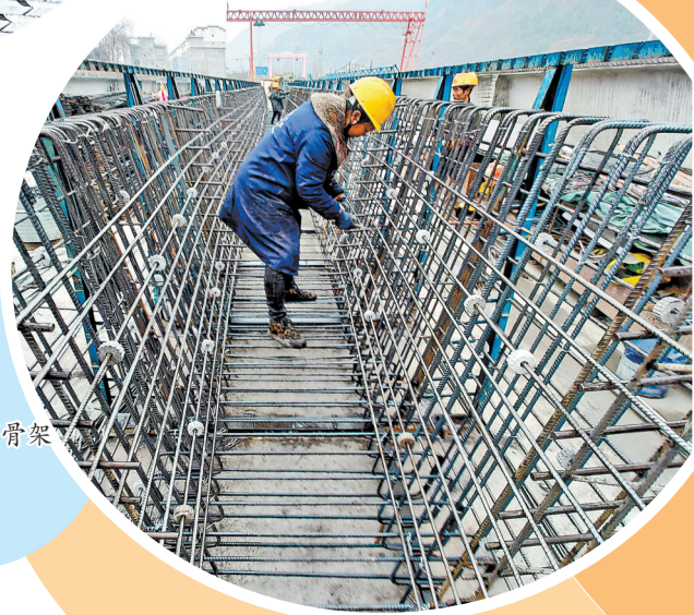
制作箱梁钢筋骨架