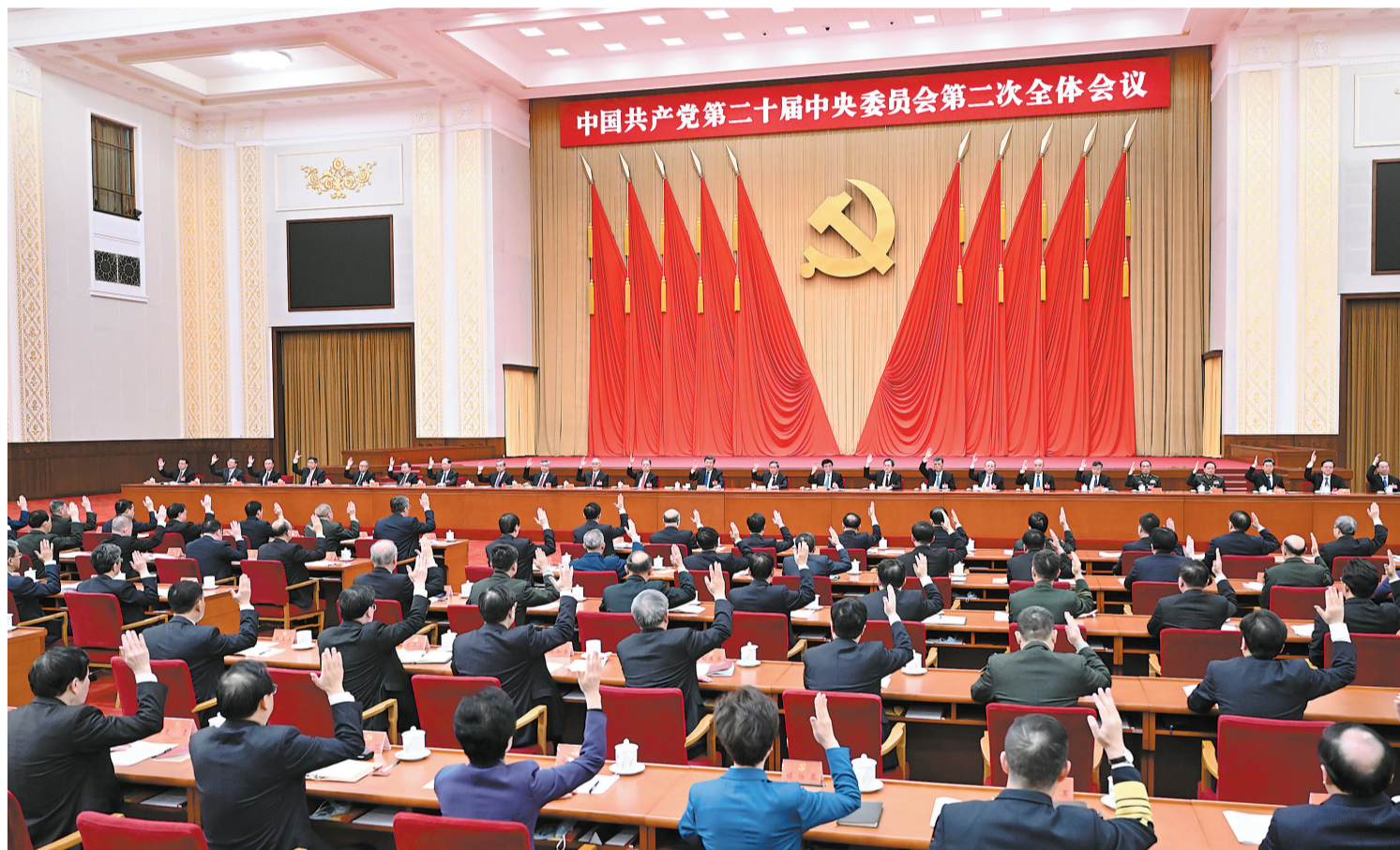
中国共产党第二十届中央委员会第二次全体会议，于2023年2月26日至28日在北京举行。中央政治局主持会议。