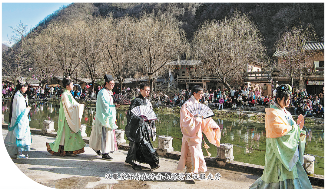
汉服爱好者在终南山寨景区汉服走秀