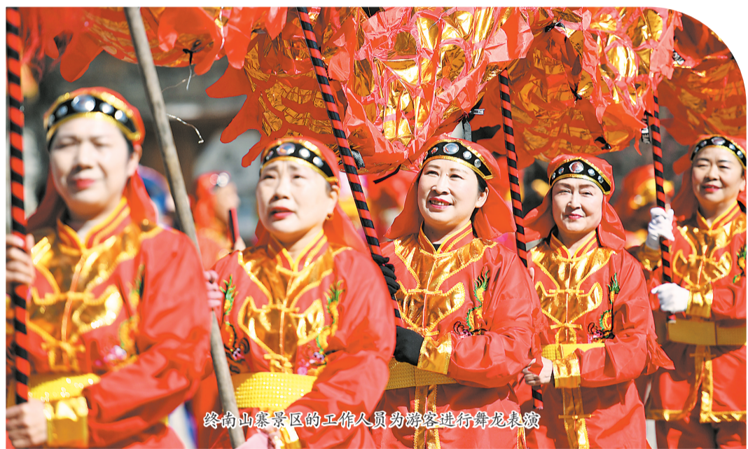
终南山寨景区的工作人员为游客进行舞龙表演