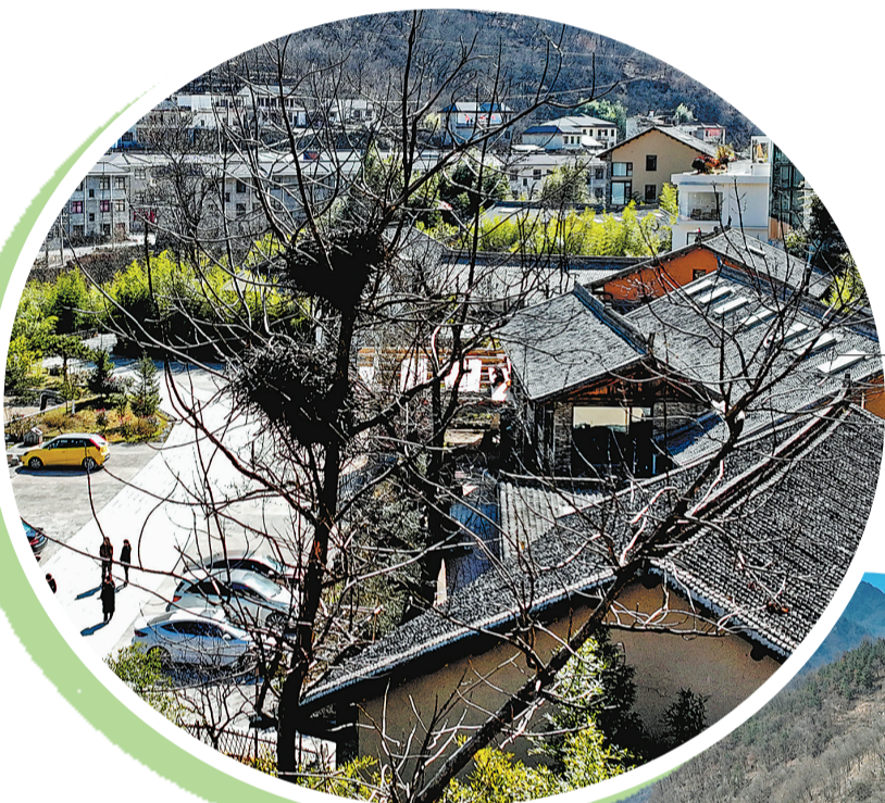
游客在环境优美的阳坡院子民宿游览