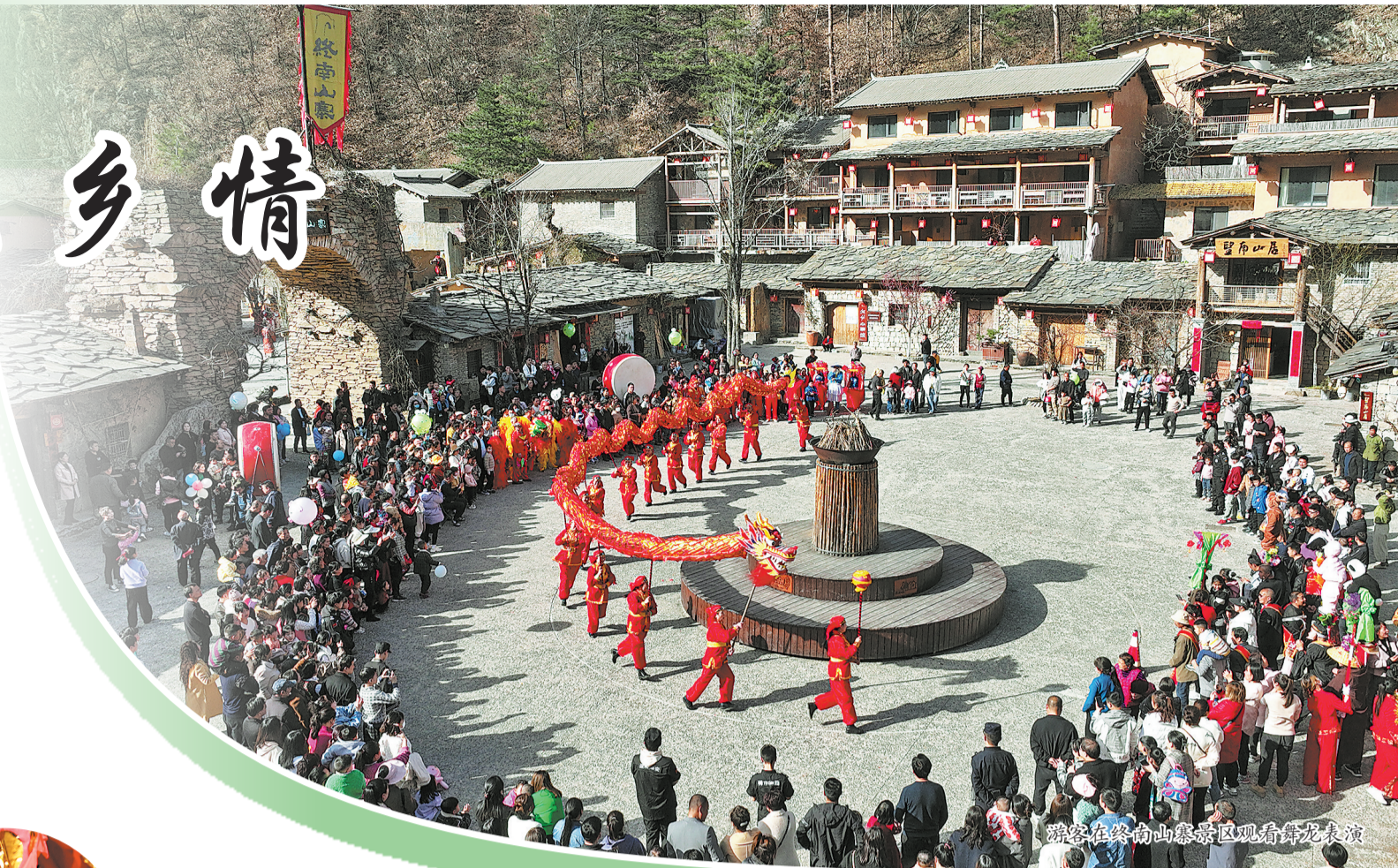
游客在终南山寨景区观看舞龙表演

陕南特色的民居建筑、浓郁的民俗风情与农耕文化，吸引着众多游人深入秦岭秘境，在古镇幽径中感受诗意乡村、寻觅袅袅乡愁。