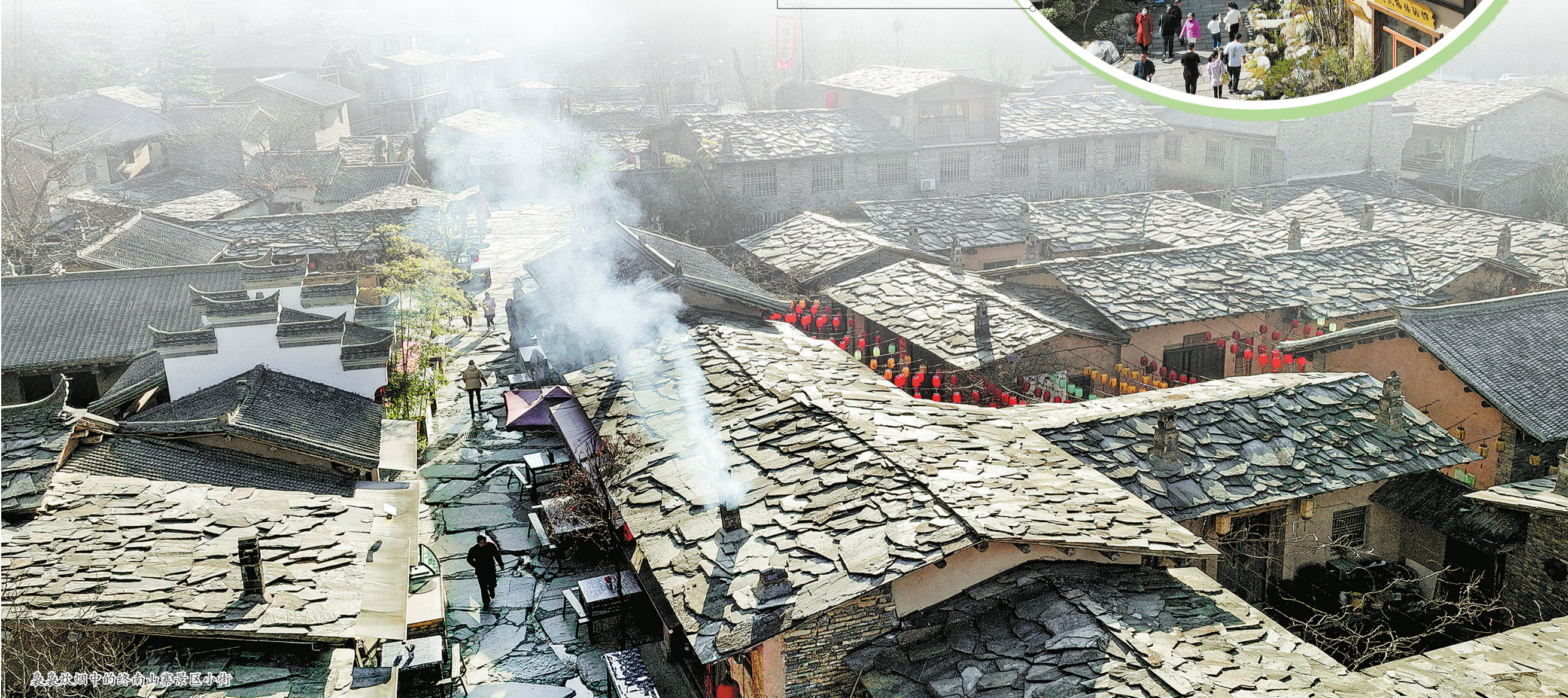
晨雾中的终南山寨景区小街