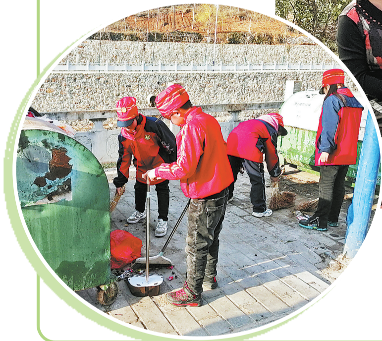
△为弘扬雷锋精神，3月7日，丹凤县雷庄镇中心小学组织少先队员到街道广场、公路沿线、沟渠河塘等区域捡拾清扫垃圾，争做美丽家园环保小卫士。