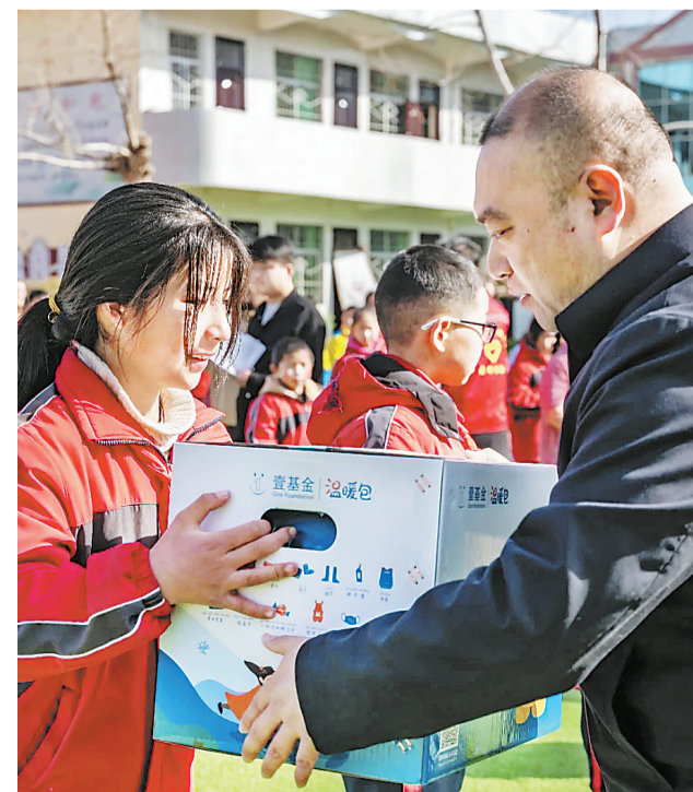
3月3日，共青团洛南县委、县总工会联合洛南县多家企业及爱心人士在景村中学举行“学雷锋 献爱心 助成长”壹基金温暖包发放仪式，现场发放价值21.6万多元的壹基金温暖包592个，部分温暖包通过转达的方式送给其他镇办的孩子们。

“一个人做点好事并不难，难的是一辈子做好事”。这是周玉川的座右铭。十几年来，他用自己的爱心行动践行着自己的座右铭，并愿意为无偿献血公益事业贡献余生力量。