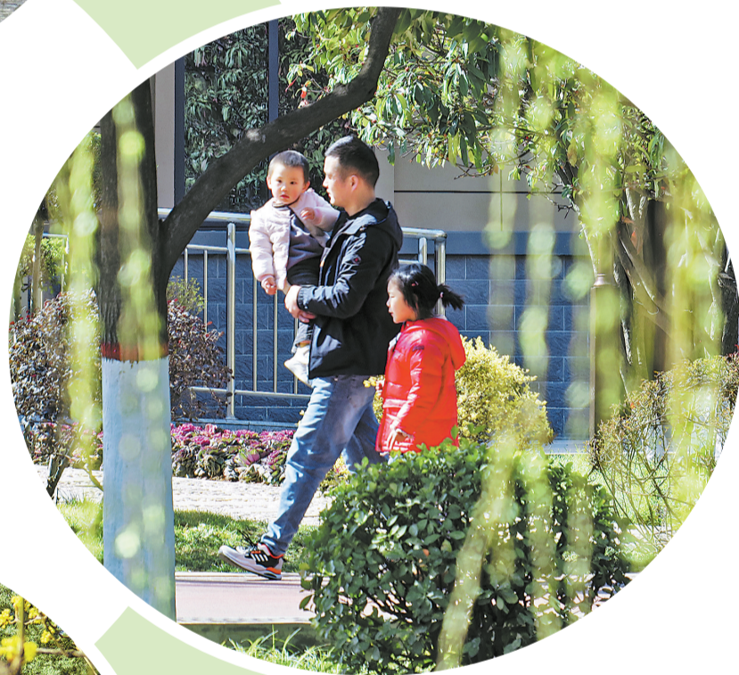
杨柳依依，出门踏青。