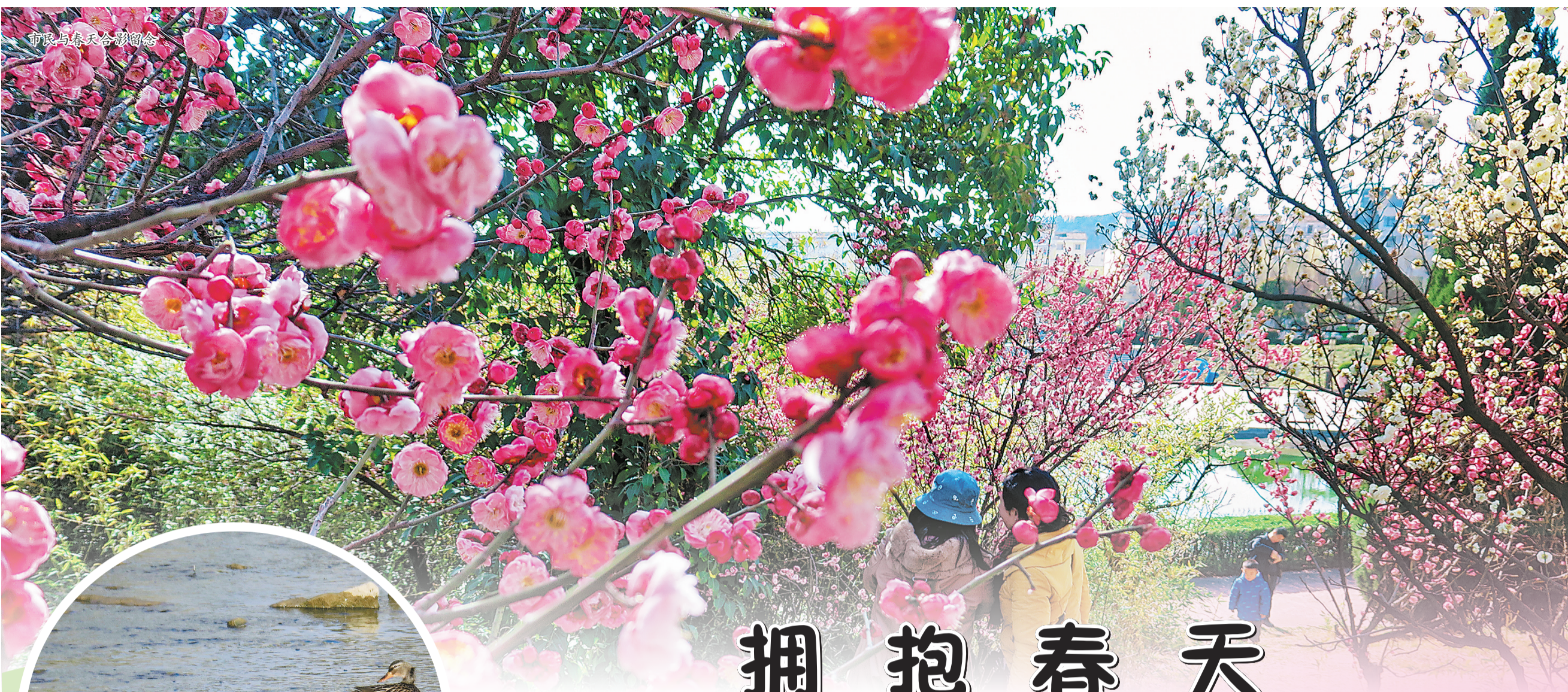
市民与春天合影留念