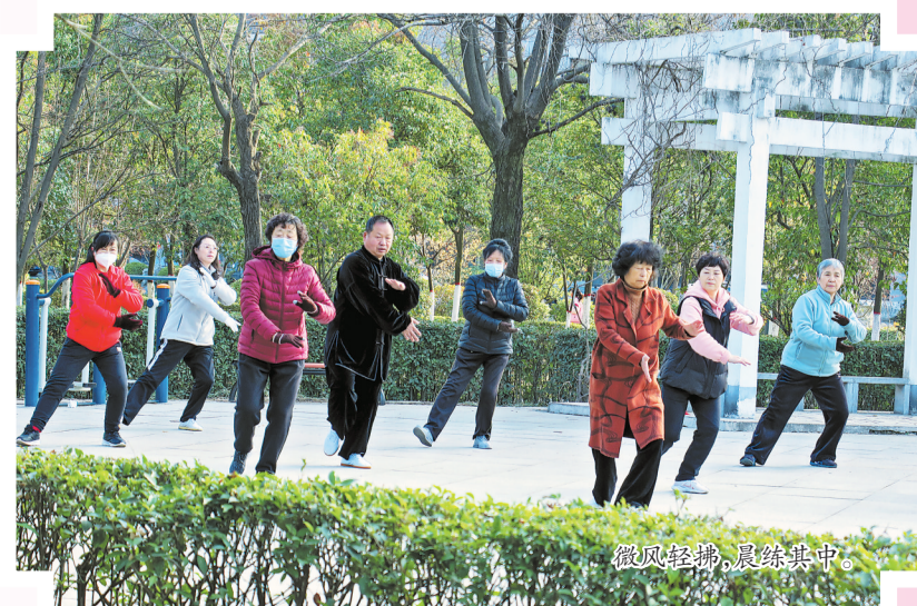
微风轻拂，晨练其中