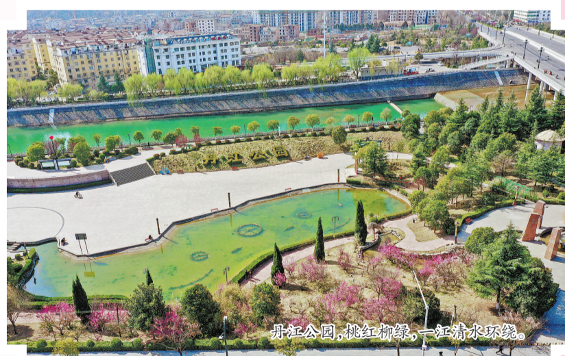
丹江公园，桃红柳绿，一江清水环绕。