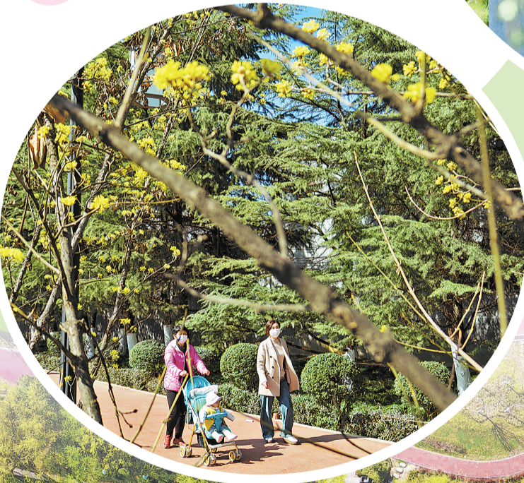
迎春绽放，畅游其中。