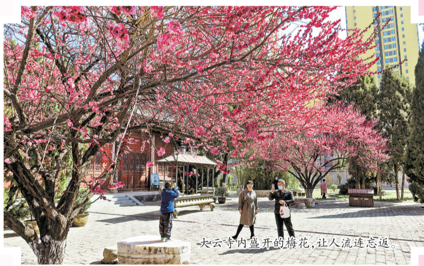
大云寺内盛开的梅花，让人流连忘返