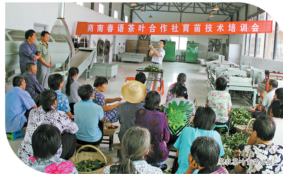
茶农茶叶育苗培训

为进一步把茶产业作为首位产业加快发展,商南提出建设“生态茶城”等“四大名城”发展目标,明确“规模、品质、品