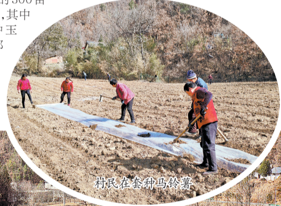
村民在套种马铃薯

群众粮袋子,又富群众钱袋子;既守牢粮食种植底线,又为集体经济增收提供新的‘动力源’。”北宽坪镇镇长郭双双说。