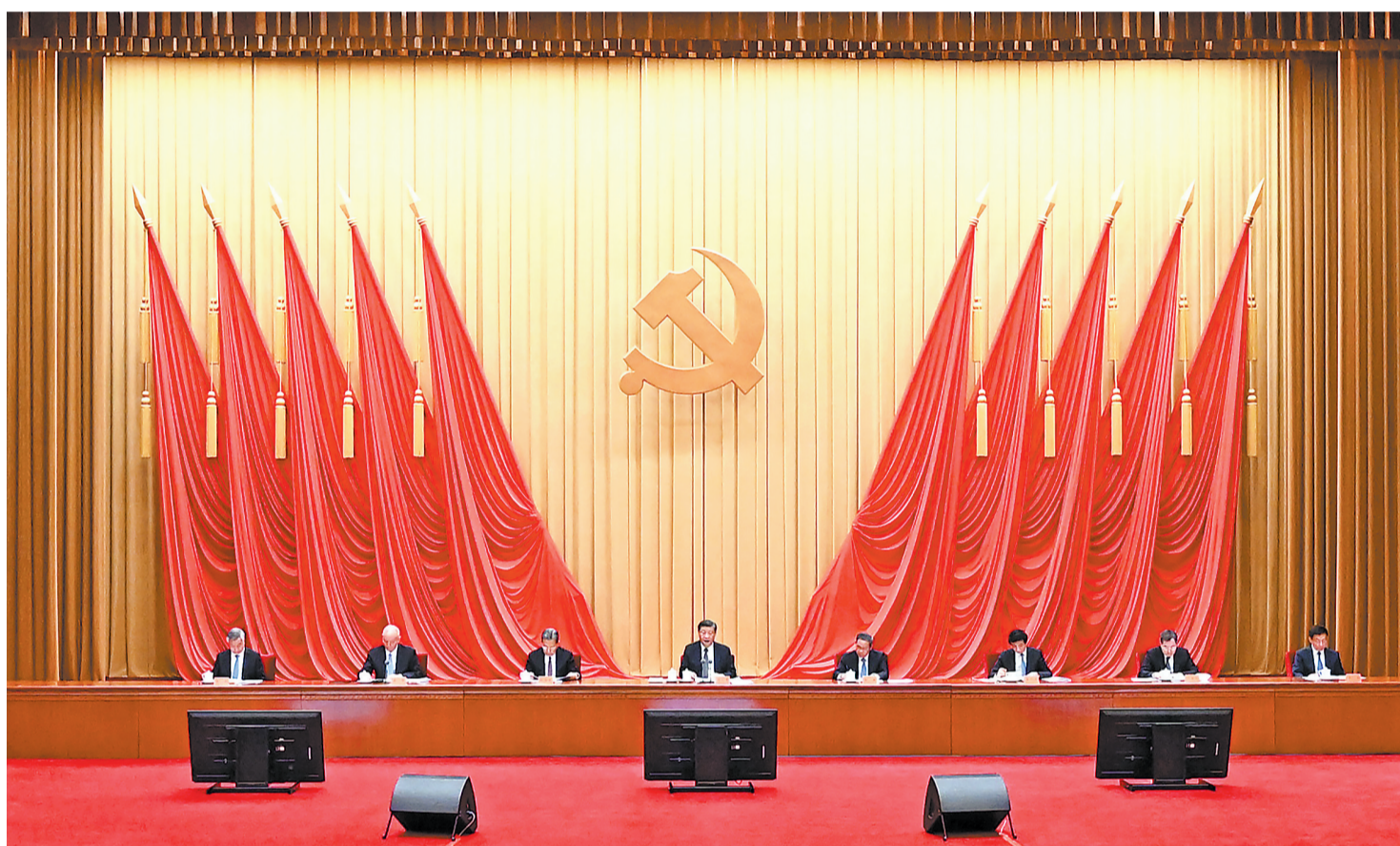
4月3日，学习贯彻习近平新时代中国特色社会主义思想主题教育工作会议在北京召开。中共中央总书记、国家主席、中央军委主席习近平出席会议并发表重要讲话。李强、赵乐际、王沪宁、蔡奇、丁薛祥、李希、韩正出席会议。

新华社北京4月3日电 学习贯彻习近平新时代中国特色社会主义思想主题教育工作会议3日在北京召开。中共中央总书记、国家主席、中央军委主席习近平出席会议并发表重要讲话。他强调，强国建设、民族复兴的宏伟目标令人鼓舞、催人奋进，我们这一代共产党人使命光荣、责任重大。我们要以这次主题教育为契机，加强党的创新理论武装，不断提高全党马克思主义水平，不断提高党的执政能力和领导水平，为奋进新征程凝心聚力，踔厉奋发、勇毅前行，为全面建设社会主义现代化国家、全面推进中华民族伟大复兴而团结奋斗。