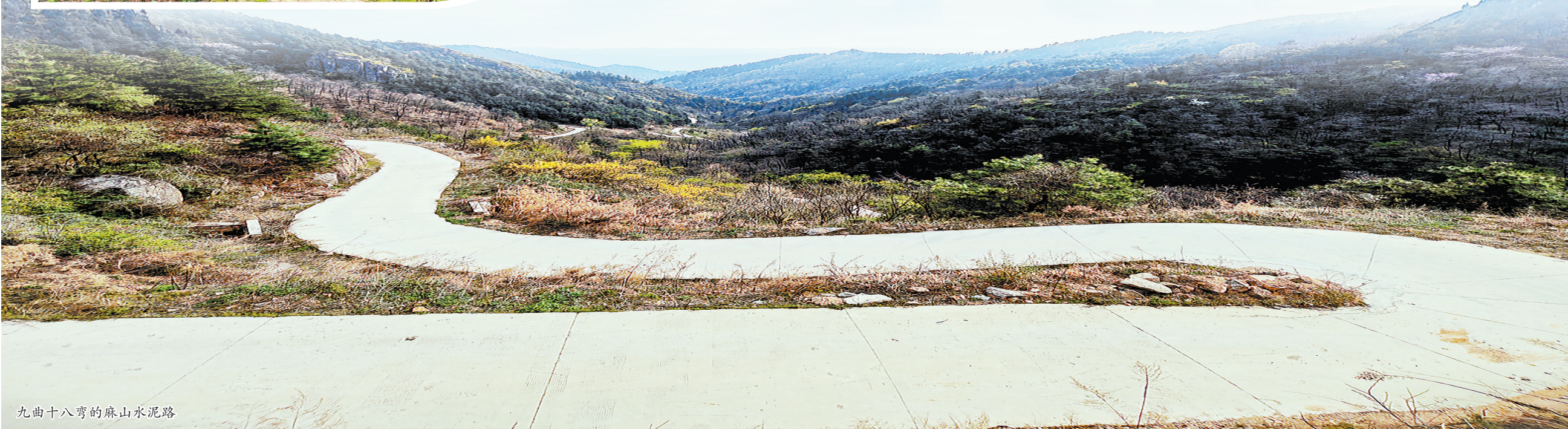
九曲十八弯的麻山水泥路