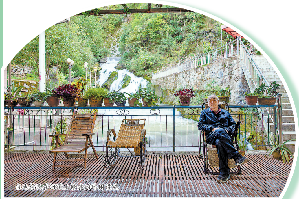
当地村民在河道上修建的休闲设施

冬天看冰。鱼洞河由于背阴,光照时间短,冬天结冰的日子多,可以看到各种形状的冰挂。据当地村民讲,有一年冬天,整个鱼洞河都结了冰,有冰吊、冰洞,还有一个三丈多高的冰柱子。