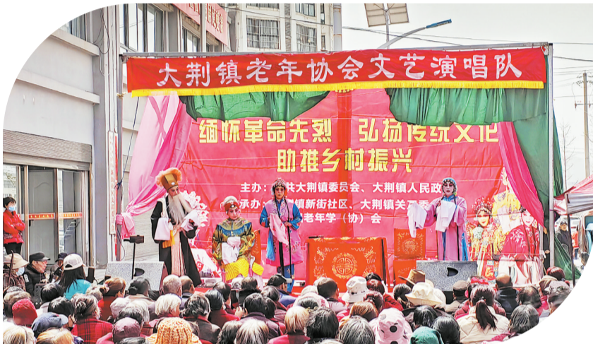
4月4日至6日,由商州区大荆镇党委、政府主办的文艺演出活动,在大荆镇新街社区党群服务中心门前举行,为群众奉上《探窑》《福寿图》《三娘教子》等传统节日。