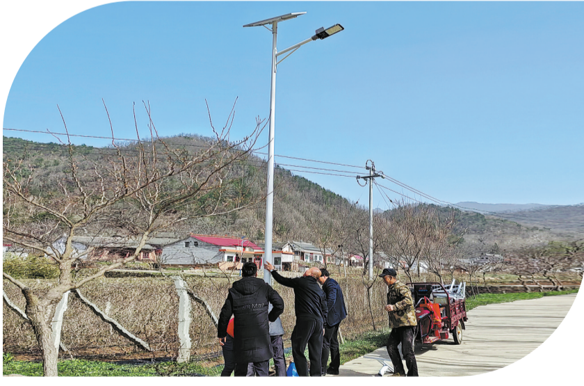
近期,洛南县巡警镇黑影村在公路主干道和产业基地边安装路灯,基本实现路灯全覆盖。此次路灯安装项目共计投入15万多元,安装路灯共50盏,受益村民278户987人。