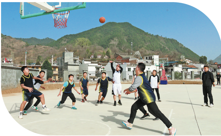
4月6日,丹凤县2023年职工运动会北片赛区开幕式在庄集镇举行。运动会设置篮球、乒乓球、羽毛球、拔河、趣味比赛等10个项目。

新增集采39种药品的252个产品平均降价56%。今年国家组织的第八批药品集中采购中选结果出炉,又有39种药品共252个产品采购成功,拟中选药品平均降价56%。本次集采涵盖抗感染、心脑血管疾病、抗肿瘤、精神疾病等常见病、慢性病用药。将大幅提高患者用药可及性,有利于促进临床合理用药,患者负担将明显减轻。