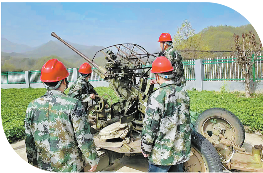
4月6日,柞水县气象局开展2023年人工影响天气应急演练,增强人工影响天气作业人员的熟练度和安全意识,为今年人工影响天气工作开展奠定坚实基础。

近日,洛南县巡警镇黑影村在公路主干道和产业基地边安装路灯,基本实现路灯全覆盖。此次路灯安装项目共计投入15万多元,安装路灯共50盏,受益村民278户987人。