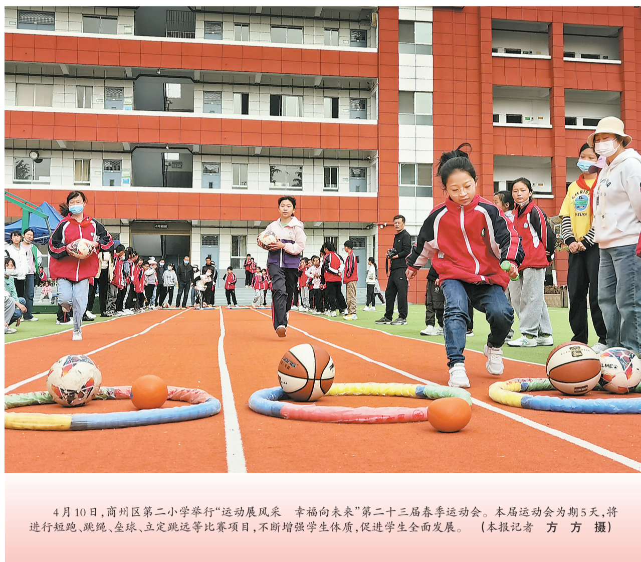
4月10日，商州区第二小学举行“运动展风采 幸福向未来”第二十三届春季运动会。本届运动会为期5天，将进行短跑、跳绳、垒球、立定跳远等比赛项目，不断增强学生体质，促进学生全面发展。