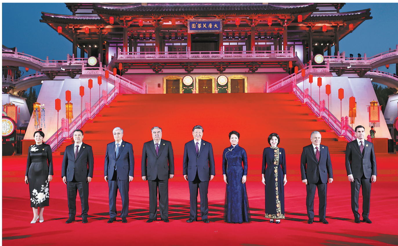
5月18日晚，国家主席习近平和夫人彭丽媛在陕西省西安市大唐芙蓉园为出席中国—中亚峰会的中亚国家元首夫妇举行欢迎仪式和欢迎宴会。宴会后，习近平夫妇同贵宾们共同观看中国同中亚国家人民文化艺术年暨中国—中亚青年艺术节开幕式演出。这是习近平夫妇在紫云楼前同贵宾合影留念。