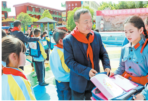
△5月24日，“六一”儿童节来临之际，丹凤县双拥办为县第五小学142名现（退）军人子女赠送双拥书包，营造了关心国防、关爱军人、尊崇军人的浓厚氛围。