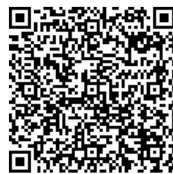
乡村振兴救助残疾儿童项目