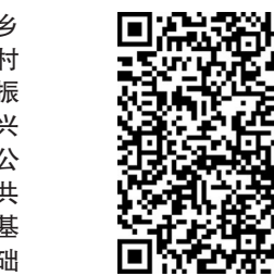
慈善幸福家园助老项目