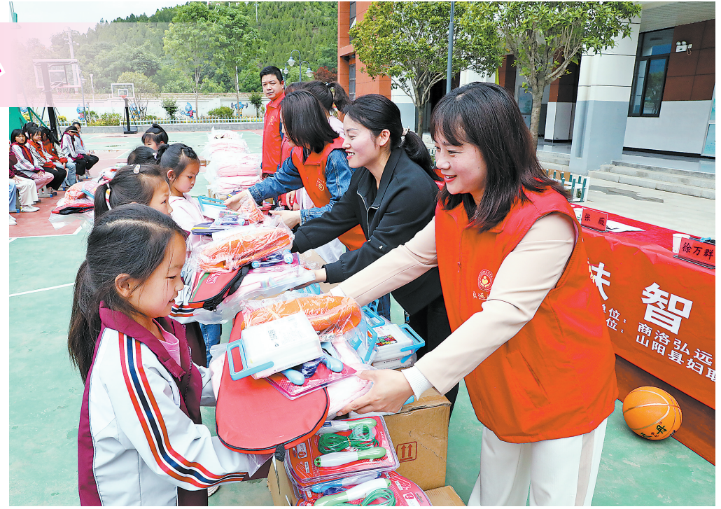
△5月24日，“乡村振兴 扶智助学”关爱儿童健康发展志愿服务系列活动启动仪式在山阳县第四小学举行。据了解，该系列活动将为商南县城关街道金福湾移民搬迁社区、丹凤县龙驹寨街道宽坪村等10个村（社区）、学校、福利机构的1325名困境儿童发放爱心助学包。

△5月20日，民进商洛市委、商州区委统战部、民进商州总支在市特殊教育学校开展“爱心助成长 真情暖童心”迎“六一”爱心慰问活动，向市特殊教育学校捐赠价值5000元的学习、体育、生活用品。