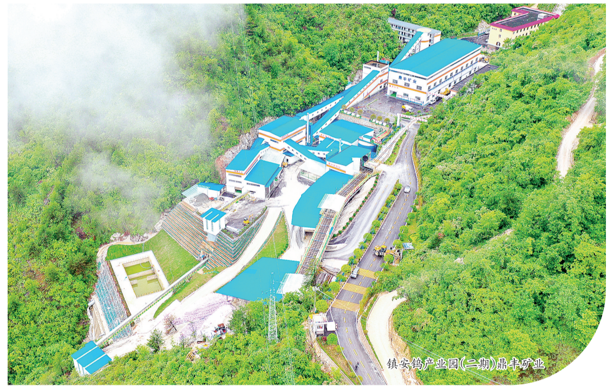
镇安钨产业园(二期)鸟瞰图

建设地点:镇安县月河镇菩萨殿村 投资主体:陕西环保产业集团有限责任公司 建设年限:2021年—2023年 开工时间:2021年3月 总投资额:12亿元 年度投资:5亿元 建设内容:镇安钨产业园(二期)项目占地52亩,主要建设有探矿工程和矿山工程,选矿生产线及综合配套设施工程。 项目亮点:一是资源富集,钨矿品位居全国第一,储量居西北第一;二是绿色开采,对地表无破坏,无废弃物露天堆放;三是环保选矿,选矿工艺国内领先,能耗低、零添加;四是尾矿回收利用,实现“吃干榨净”;五是管控数字化、智能化;六是产值和税收贡献大。今年预计可实现产值3亿元,税收7000万元。截至5月底,已实现工业产值1.12亿元,上缴税收2500万元。 建设意义:项目是立足于镇安钨资源开发,建设钨新材料基地,实施工业倍增计划,打造“中国西部钨都”的战略型钨型企业,是助推镇安经济社会高质量发展的新引擎。 亩均效益:亩均完成投资1000万元,项目达产后,预计亩均年产值1057.69万元,亩均年税收242.31万元,年解决就业600多人。 项目进展:累计完成投资5.2亿元,2023年1至5月完成投资1.85亿元,探矿成效显著,已探明钨矿储量273万吨,矿山掘进2万多方,5个智能化坑口具备生产扩矿条件;已建成年处理矿石30万吨、年产钨精粉3000吨的选矿生产线并投产;宿舍楼等配套设施建成投用。