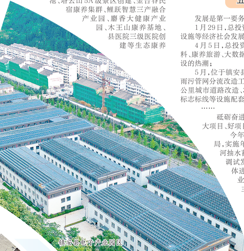
镇安生态休闲公园