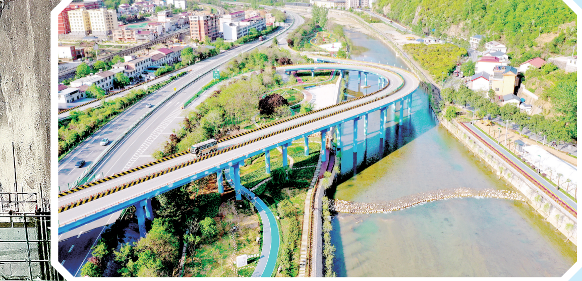
西康高铁镇安段施工现场