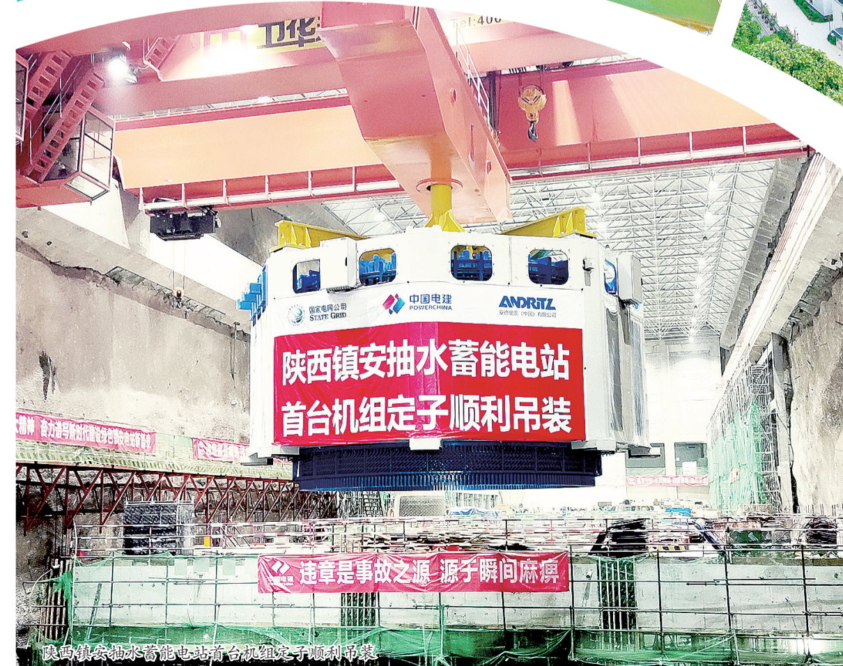
陕西镇安抽水蓄能电站首台机组定子顺利吊装