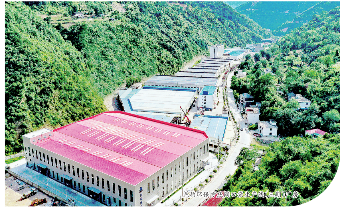
尧柏环保方底阀口袋生产线(三期)厂房

建设地点:镇安县县城工业集中区内 投资主体:陕西柏宏欧利塑业有限公司 建设年限:2022年10月—2023年5月 开工时间:2022年10月 总投资额:8亿元 年度投资:3亿元 建设内容:项目总占地面积20亩,新建标准化厂房1.8万平方米,增设6套新型环保抽吸生产线,购置6台德国进口多功能阀口袋,配套建设相关附属设施。 项目亮点:企业在节能环保、绿色低碳发展理念的基础上,不断延伸补链,节能环保再升级,年节能折合标准煤1300吨,能耗比传统工艺降低30%,走上了绿色发展的新路径。 建设意义:该项目依托国家产业转型升级、绿色智能制造、一带一路政策等优势,引进德国W&H(威德霍尔)多功能密封焊接阀口袋设备,项目投产后,可年产3亿条环保耐热型方底阀口袋,预计年产值3.5亿元,年新增税收3400万元,带动就业300人,年出口创汇增加至3000万美元,企业创汇能力居全市前列。届时,该公司将成为中西部地区最大乃至全国领先的方底阀口袋生产企业。 亩均效益:项目建成后预计亩均年产值1750万元,亩均年税收242万元。 项目进展:目前项目累计完成投资8亿元,2023年完成投资3亿元,已完成厂房主体建设及装修,阀口袋生产线设备已到场6套,并完成安装调试。