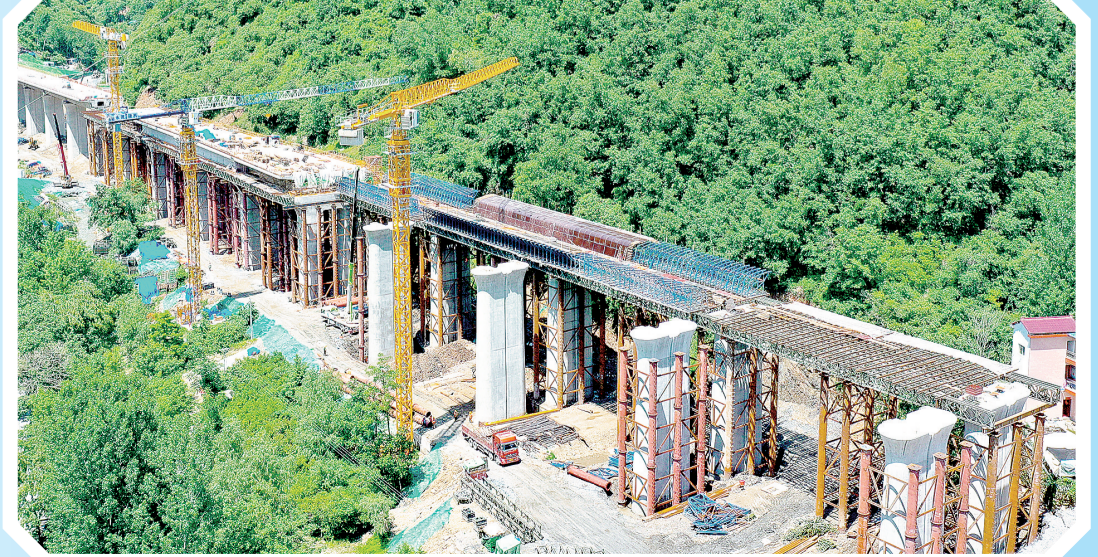
西康高铁镇安段施工现场