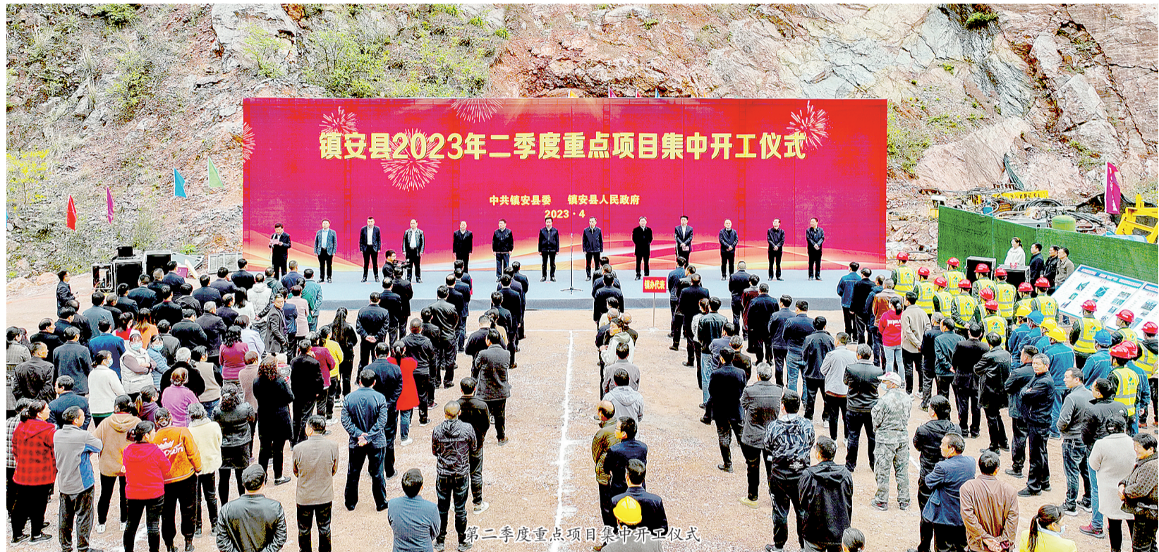
镇安县2023年二季度重点项目集中开工仪式