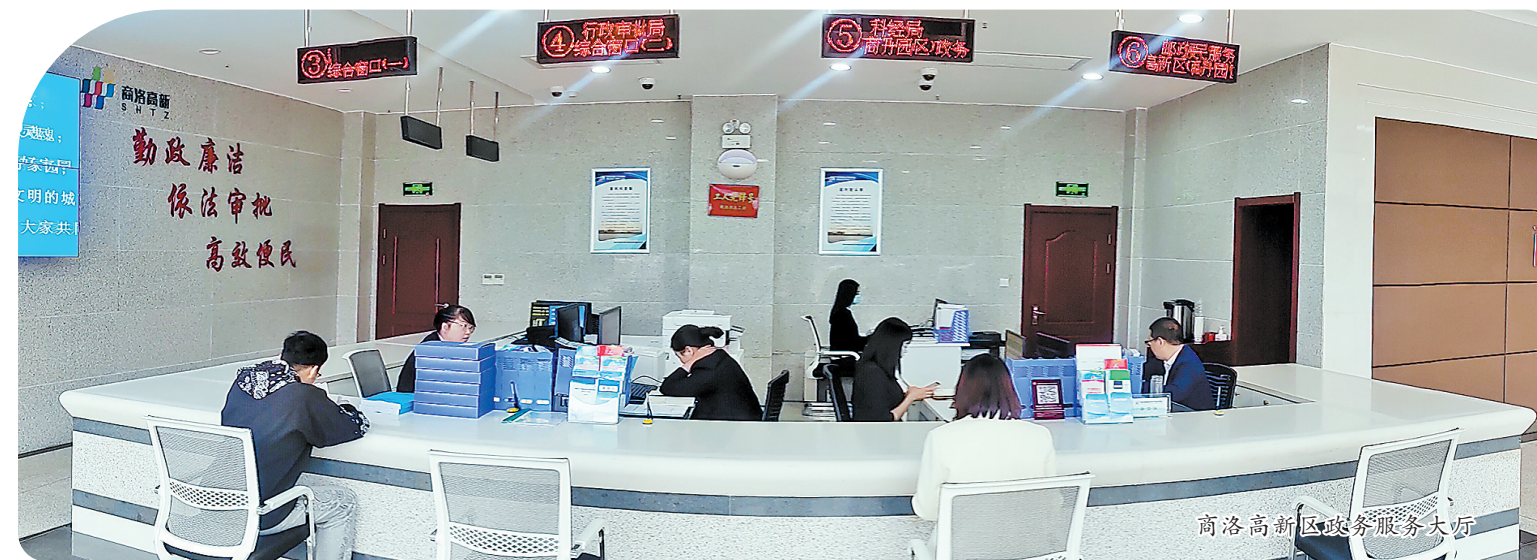
商洛高新区政务服务大厅