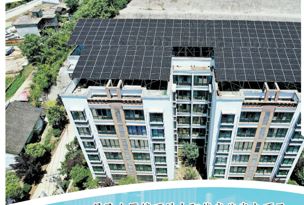
居民小区楼顶的太阳能光伏发电项目