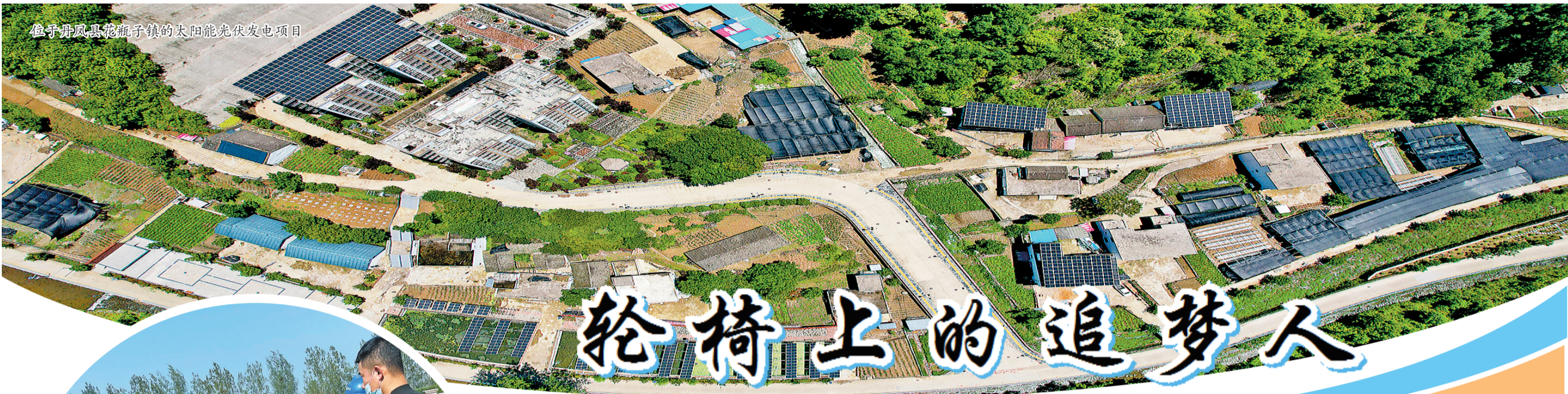
位于丹凤县花瓶子镇的太阳能光伏发电项目

广“终南宿集·共享村庄”招商模式。先后引进北京金山教育科技有限公司、辽宁三友农业生物科技有限公司、北味菌业科技集团有限公司等企业到柞水考察，石瓮西城高端民宿项目已达成合作意向，即将启动房屋流转。策划康养项目8个，已签约康养项目1个，合同签约27.04亿元。积极打造链主企业，重点培育陕西盘龙药业集团股份有限公司、陕西三八妇乐特医食品有限公司等一批康养龙头企业，明确3家市级重点康养企业包抓责任。目前，柞水终南医养院、终南山寨康养民宿街区、九星温泉汤院等一批康养服务产品相继建成。